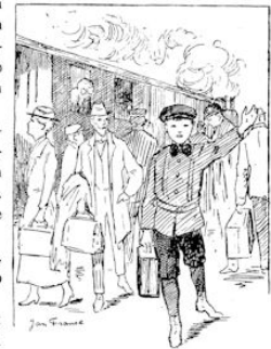
EINDELIJK KWAM HIJ.

Eindelijk kwam hij. Hij droeg een donkerblauw pak, met een band over den rug en veel zakken met knoopjes er op. Uit de korte broek kwamen zijn stevige beenen. Hij droeg zwarte kousen. En op zijn lang blond haar droeg hij een donker grijze pet. In zijn linkerhand torste hij een grooten bruin-