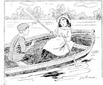
DE EENE RIEM WOU NIET ZOOALS DE ANDERE.

Menco lachte haar wat uit. „Toe nou, heldin.” Ze voelde zich zoo driftig worden en blaakte van