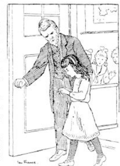
VORLDE ZE ZICH BIJ DEN ARM GEGREPEN.

over wat er dien morgen gebeurd was. Alleen, ze vond het bepaald verdrietig, scheen hij heelemaal geen notitie van haar te nemen. Ze had het gevoel, dat hij over haar heen keek, of ze lucht was. Zoo gauw haar gedachten maar even afdwaalden, scheen hij