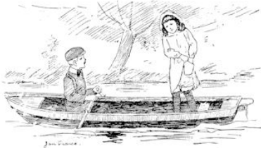
NU IS MIJN BEURSJE WEG.

„O, zooveel heb ik wel.” Mientje zocht in haar zak. Maar haar beursje was weg. Waar had ze 't toch gelaten! In haar tashje gekeken — nee, ook niet. Kon ze 't op 't tafeltje hebben laten liggen? Nee, want Menco had betaald.