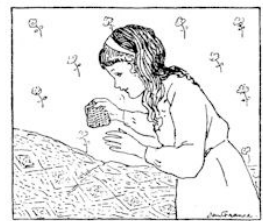
NAM HET IN DE HAND.

N. Z. S. No. 47. Mondjegeauw. Tweede druk.