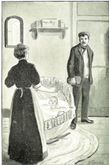
„Al was ik niet getrouwd, dan zou ik tóch van 't jaar meerderjarig zijn geworden!” blz. 40

't Was waar: ze had tegenwoordig zorgen, die ze tot heden toe niet gekend had.