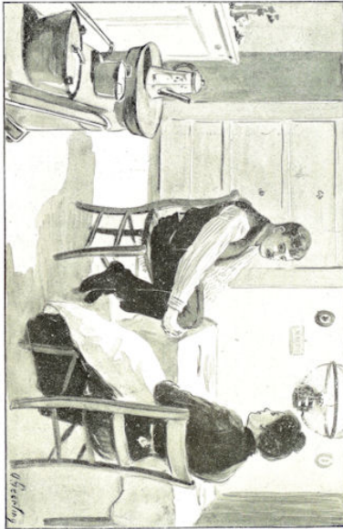
.... sloeg zijn lange armen om 't u, 't u, 't u hoog opgetrokken knieën, .... Blz. 19