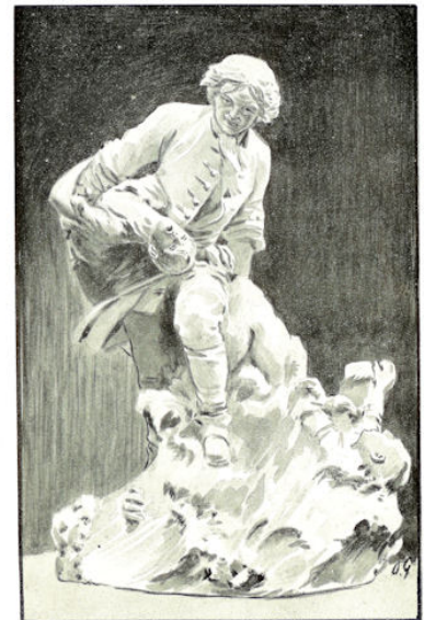
STANDBEELD VAN Tsaar PETER DEN GROOTE TE ST. PETERSBURG hem voorstellende als redder van schipbreukelingen te Kronstadt in 1721