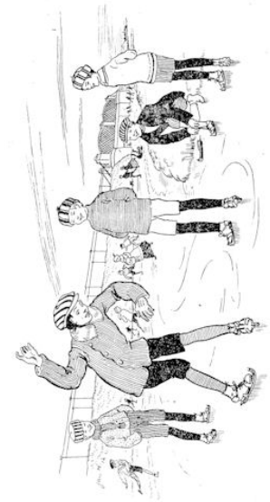
„Even stond hij.”

En het vroom door. Wat werden er 'n steenen op 't ijs gegooid, om te probeeren, of 't al een beetje houden wilde. Wat waren er 'n jongens, die eventjes met de klomp aan den kant probeerden, of ze 't ijs nog konden stuk stompen! 't Was al aardig stevig. Gerust, je kon je schaatsen wel opzoeken en laten scherpen. Morgen zouden ze zwieren. Den volgenden dag kwamen bijna alle kinderen met