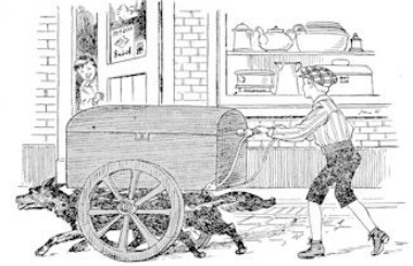
En dat hoofd stak de tong uit tegen hem.

't Was Klaas weer; „nu durf je, hè! bij je huis. Maar pas op, dat je morgen bij school uit mijn vingers blijft!”