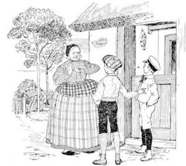
Heden mijn tijd! Wie had dat gedacht.

„Ja,” zei Piet. „We kunnen heel wat doen. We hebben elk een daalder, zie je!” Weer lachte het vrouwtje. „En,” zei ze, terwijl haar oogen hen nieuwsgierig van