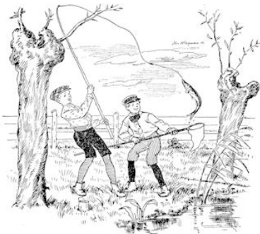
Hij hield het schepnetje onder den snoek.

Daar lag hij in 't gras. Hij maakte een herrie voor drie. Spartelen van wat ben je me.