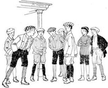
Jij weer vechten willen, ja?

„Ik ook," riep Piet, en nu volgden alle jongens. „Gemeen," schreeuwde Klaas. „Jullie bent allemaal valsch. Maar ik zal je wel krijgen. Nou heeft ie lef, nou