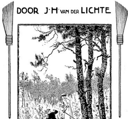
MET TEEKENINGEN VAN E. J. VEENENDAAL