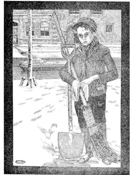
Illustratie uit „Wouter” door CHR. DOORMAN.