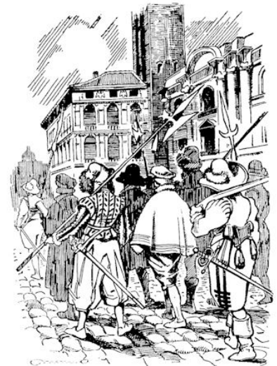
„... daarom namen zij de heren gevangen.”

'n Week lang ging Maffio niet meer naar de gevangenis. Overdag had hij het druk en omdat er niets bij-