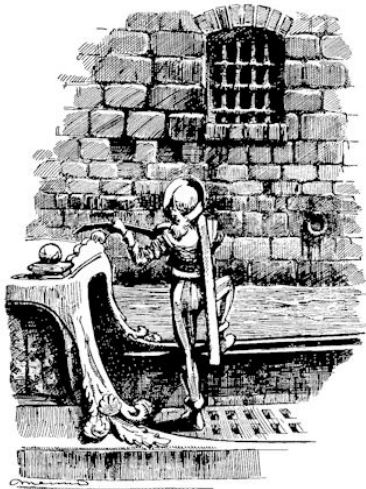
„Is u daar, vader?”

't Gaat goed met de vrouw, zij zit veilig in huis, De kind'ren zijn bij haar, zij draagt stil haar kruis.