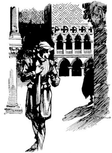
Hè, is dat schrikken!