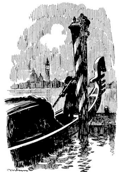
DE GONDELIER MEERDE Z'N GONDEL. (Zie blz. 7).