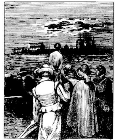
Nu stond hij op de plank!

van z'n vader reeds. Hij tastte naar het hoofd van Nicco en bracht dat met inspanning van alle krachten boven water.