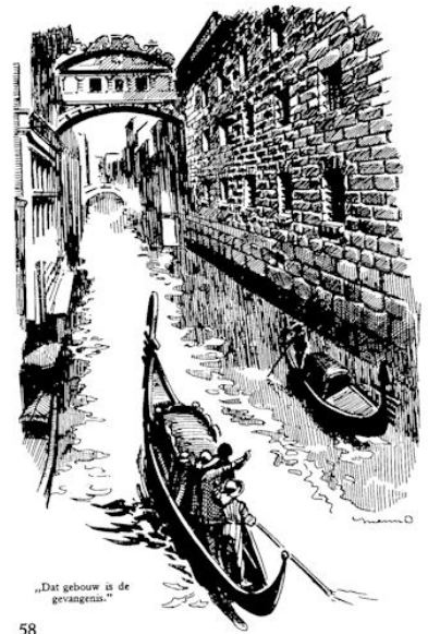
„Dat gebouw is de gevangenis.“

„Zo, is dat nu de gevangenis,“ dacht hij, „dan zit daar nu mijn arme vader. Wist ik nu maar precies wáár hij zit, misschien kon ik dan met hem spreken. Maar het gebouw had zoveel luchtgaten en alle leken ze op elkaar. De gevangenen konden er natuurlijk niet door kijken, daarvoor zaten ze te hoog. Hoe zou hij nu ooit kunnen uitvinden waar vader zat?“