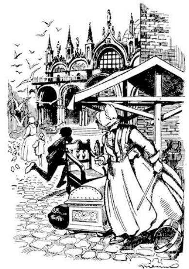
„Hé, lelijk ketterijong, moet jij m'n beeldjes breken!”