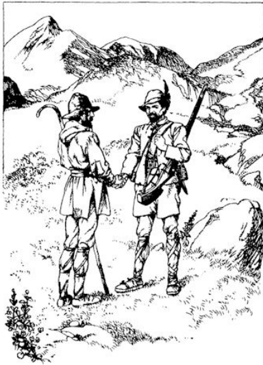
Claude drukte de herder de hand.

waar berouw tot God te wenden. Voorts moest door ieder gezin zoveel mogelijk voorraden van voedsel, klederen en gereedschappen worden verzameld.