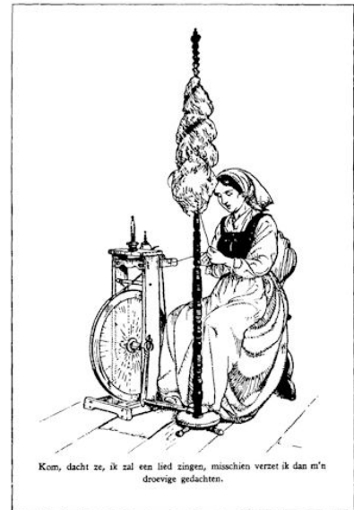
Kom, dacht ze, ik zal een lied zingen, misschien verzet ik dan m'n droevige gedachten.