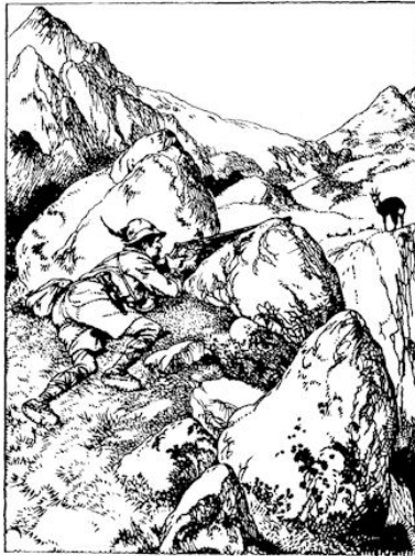
„KIJK JIJ NOU EENS VOOR JE”, MOMPELDE DE JAGER . . . (Blz. 15).