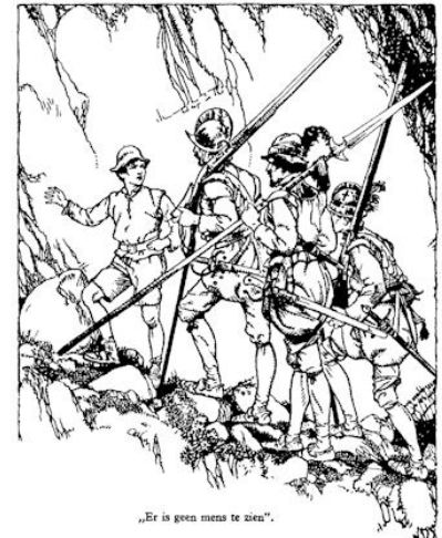
„Er is geen mens te zien.”

De soldaat gaf antwoord en La Torre schrok daar toch van. 't Was wel zaak, om er even over na te denken. Ze waren nu de poort tot op 'n paar honderd meter