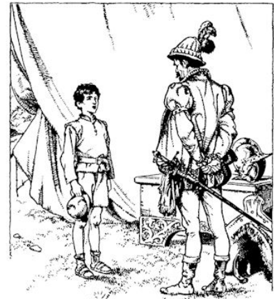
„Maar dat is verraad, generaal, daartoe leen ik mij nooit!” zei hij dapper.

„Dat weet ik niet, generaal.” „Maar jij bent toch die trommelslager?” „O, jawel, ik zocht naar de geiten van tante.” „Ja, ja, dat is ook zo, dat praatje heb je me destijds ook al wijs willen maken. Maar zeg er is, zou je niet graag naar huis willen? Je woont in de Pra, is 't niet?” „Ja, generaal, daar hebben we altijd gewoond en ik zou er graag weer heen willen, ik verlang erg naar m'n moeder.” „Nu goed, je kunt er heel gauw heen.” Pauls gezicht straalde. „Dank u wel, generaal, dank u wel!” „Ja, ja, wacht es even, dat gaat daar zo niet, ik geef je een afdeling soldaten mee, om je veilig te geleiden.” „Dat behoef niet, generaal,” zei Paul, die niet dadelijk de bedoeling begreep, „ik kan de weg heel goed alleen vinden.” „O zo, ken jij de weg zo goed, nu zoveel te beter, dan kun jij mijn soldaten tot gids dienen, want zij moeten juist in de Pra zijn, begrijp je?” Ja, nu begreep Paul het heel best. Hij moest de weg wijzen naar de Pra, hij moest zijn eigen volk verraden. De jongen werd krijtuit, toen dit tot hem doordrong. „Maar dat is verraad, generaal, daartoe leen ik mij nooit!” zei hij dapper. „Net zo als je wilt, vrind, dan stuur ik je naar Nizza en de Hertog zal wel weten, wat hij met zo'n taie Waldenzer moet beginnen.” Naar Nizza! het duizelde Paul. Dan zag hij zijn moeder wellicht nooit meer. „Daar heb je niet veel zin in, dat zie ik al,” zei lachend de generaal. 64