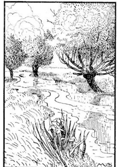
Dwars door de groote, wijde zaal liep een watertje.