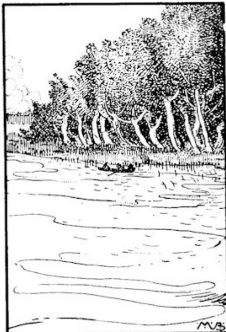
We varen langs het vlietbosch.