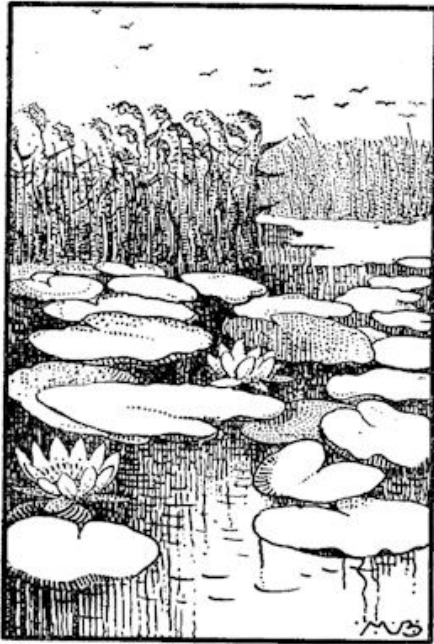
Vóór dat riet drevan op 't water de grootte, glanzende plompeblaren.