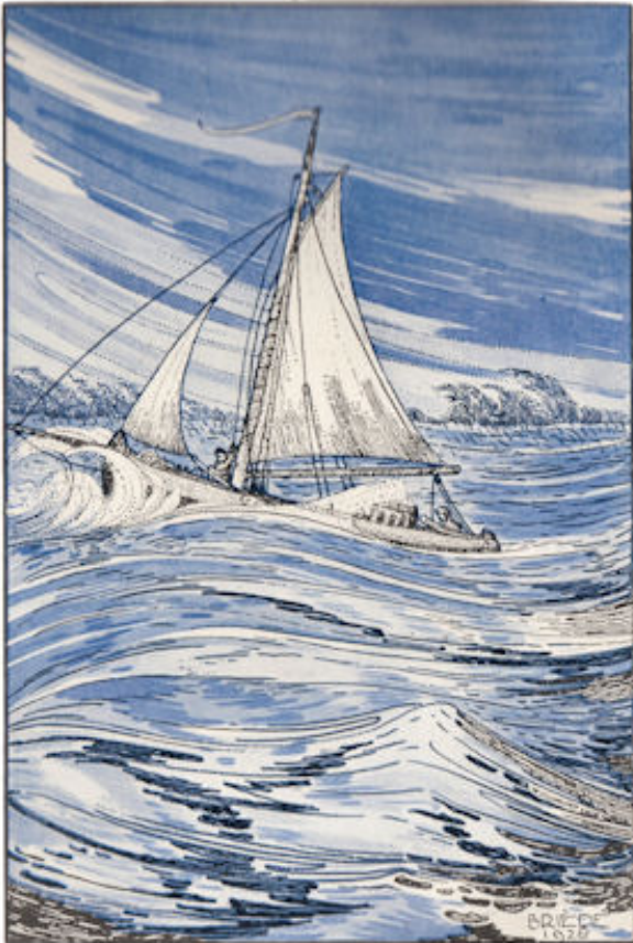
Als 't dan es hard waaide en we moesten de rivier uit gaan klappen. Pag. 131