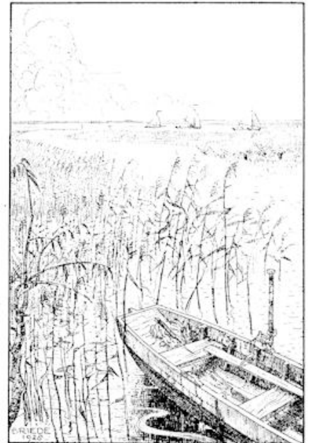
Je kon hier zo'n fijn stil gaan zitten en droomen.