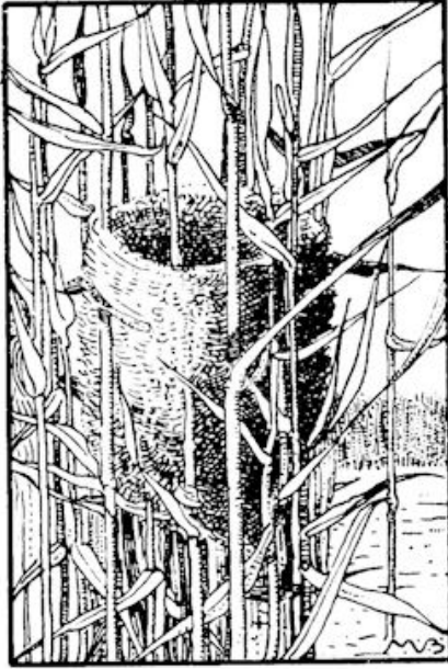
Ze keken tusssen 't riet, of ze geen „karrekiet”-nestjes zagen.