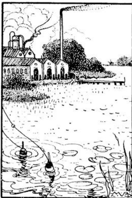
.... en hij zag z'n dobber.