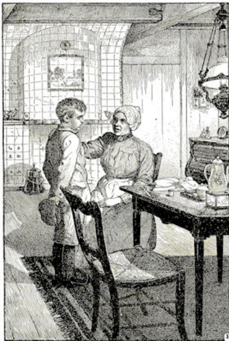
„Zie je, m'n jongen, zó gaat het niet.“ Blz. 208