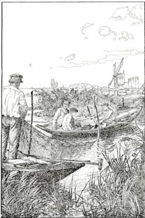
„d'r bennen kapers op de kust....”