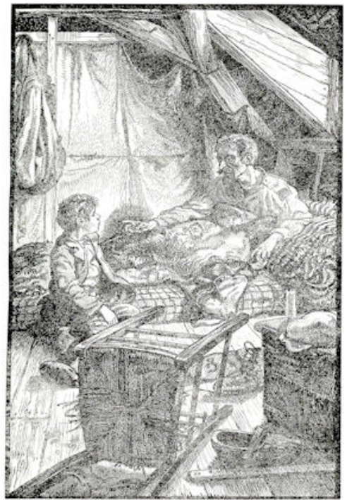
„Jij moet onhoog.... Ketelje....”