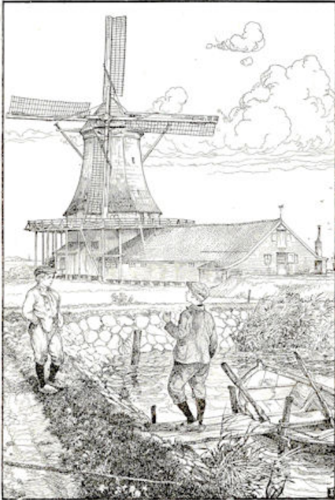
„vissen in een ander z'n netten?”