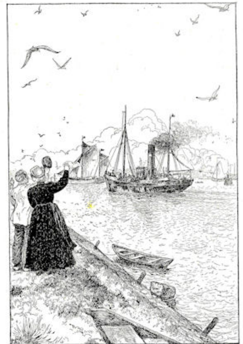
„.....Dag!“ riep hij toen nog luid. Blz. 217