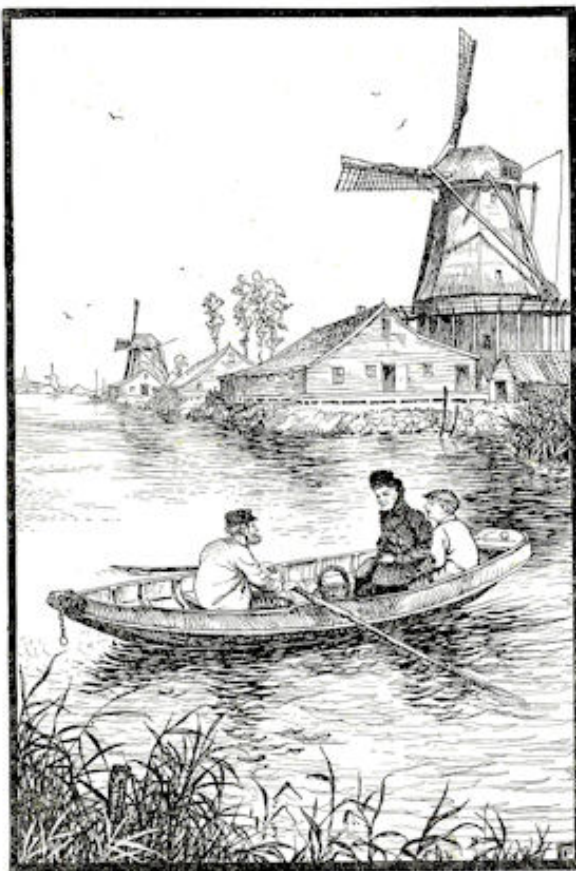
Ze zaten naast mekaar nu achter in de boot. Blz. 290