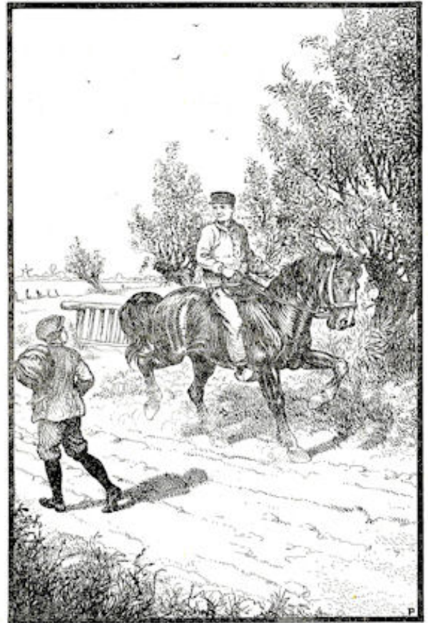
„Hallo,” riep hij van uit de hoogte vrolijk naar Keteltje. Blz. 275