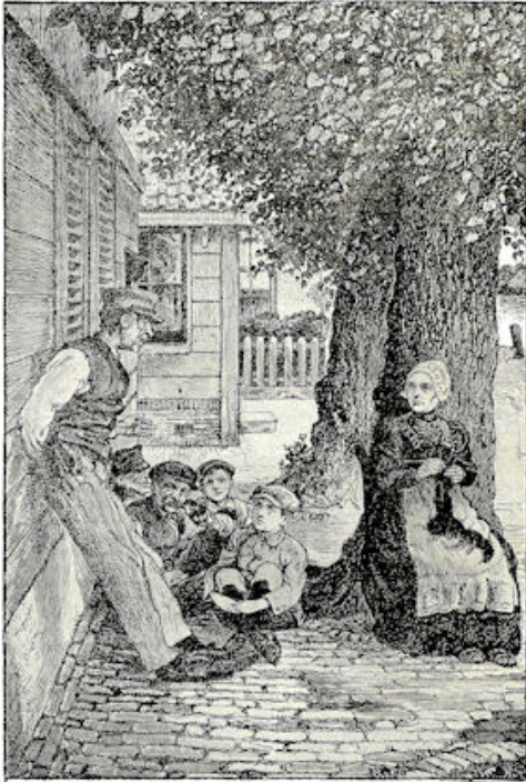
Hij ging met zijn rug tegen de muur bij moeder Pieterse staan. Blz. 127