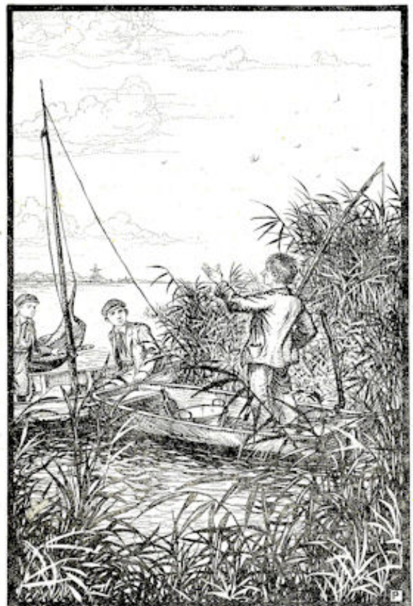
In een ouwe, platte vlet, stond Timus. Blz. 303