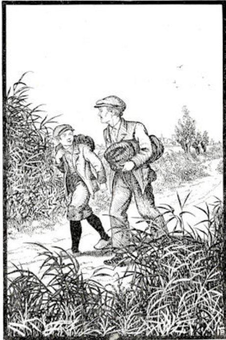
„Wat wil je nu verder?” vroeg Wouw. Blz. 279