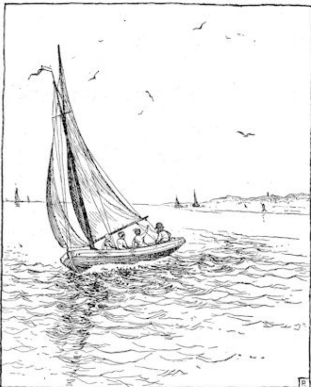
... begon de boot zich langzaam van het strand te verwijderen.