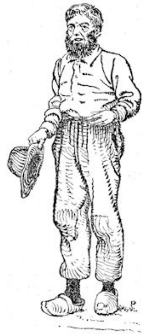
„Mooi weertje, mevrouw.”