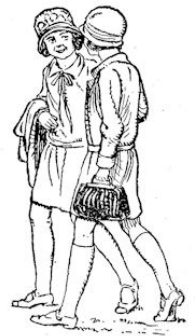
„Hoe lang heb jij vakantie?”