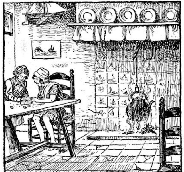
Het doosje met de schelpjes.