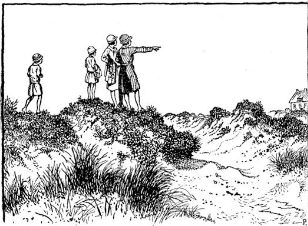
„'t Ligt midden tusschen de duinen.”