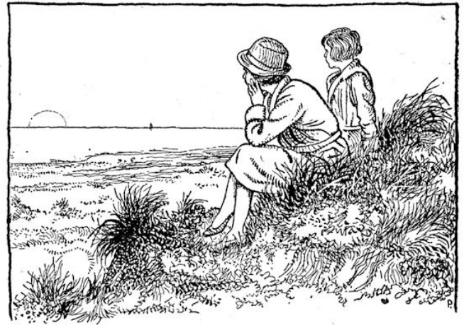
Alles om zich heen vergat ze.