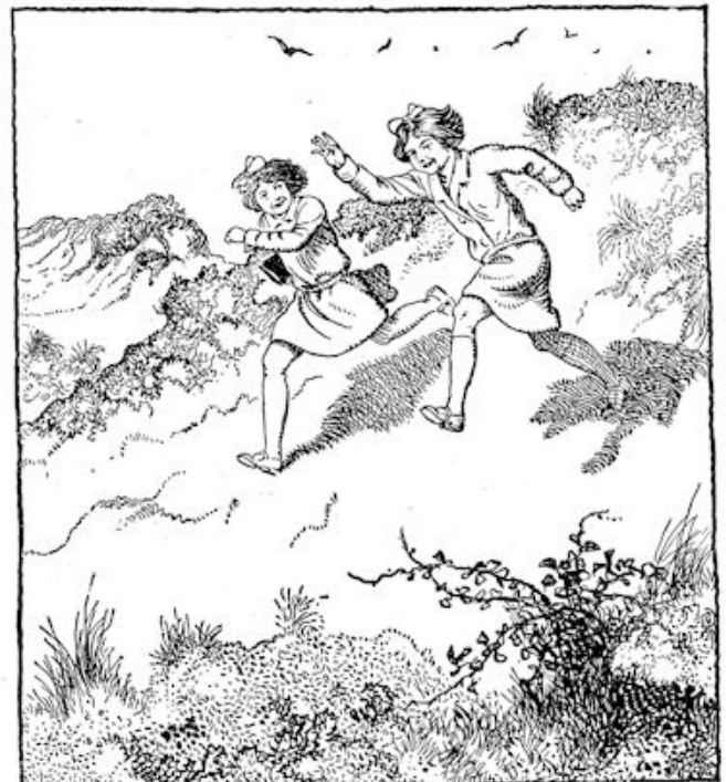
.... renden ze lachend naar beneden.