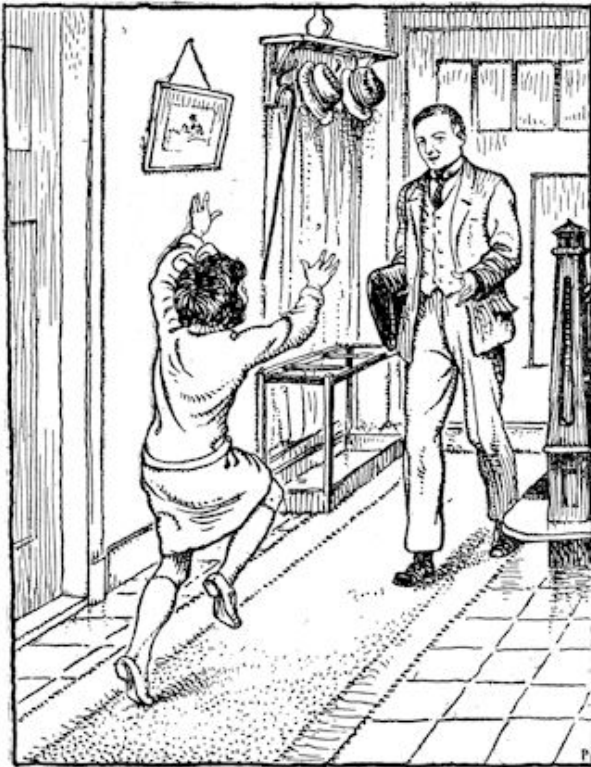
„Wel, wel,” zei vader lachend.