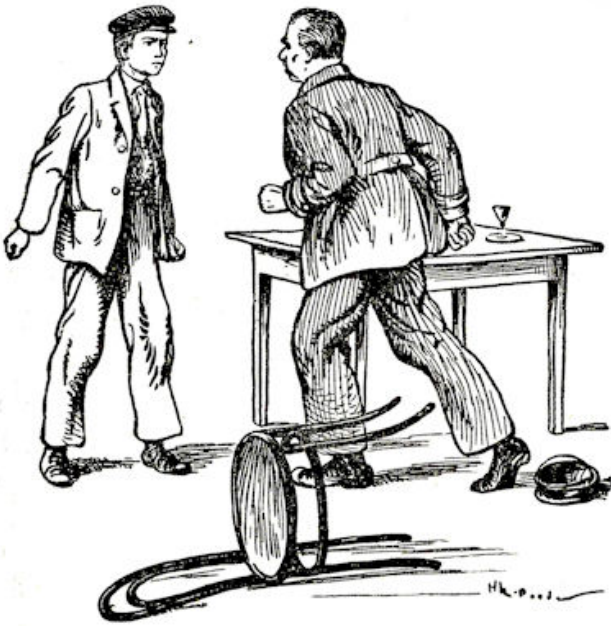
Razend kwam hij overeind — vloog op Jelle toe . . . .