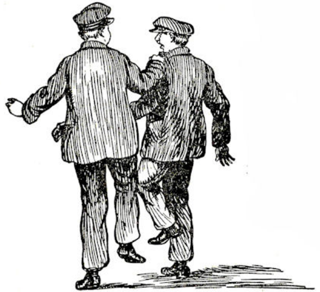
De twee praatten luid.