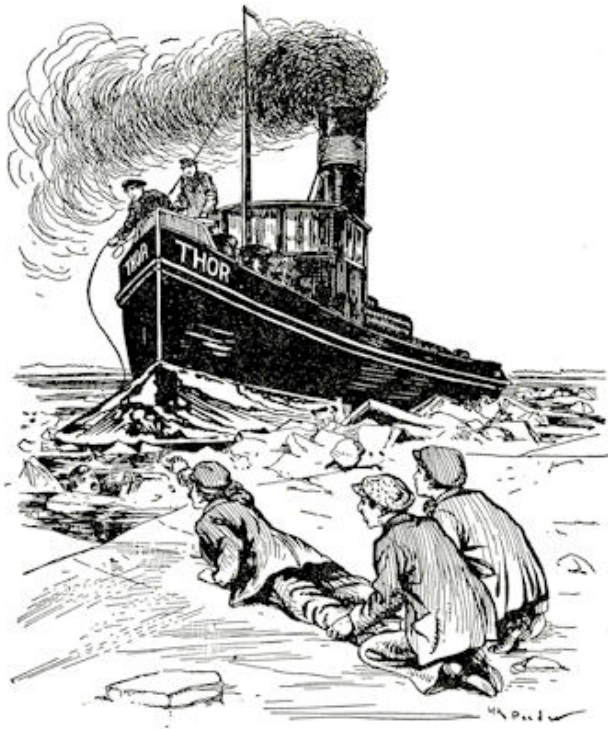
.... HIJ LAG OP Z'N BUIK, BIJ DE BENEN VASTGEHOUDEN DOOR WERKLUI. (Zie blz. 23).