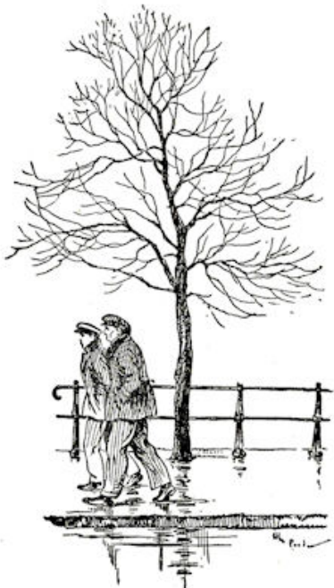
Ze waren op het Oude Delft gekomen.