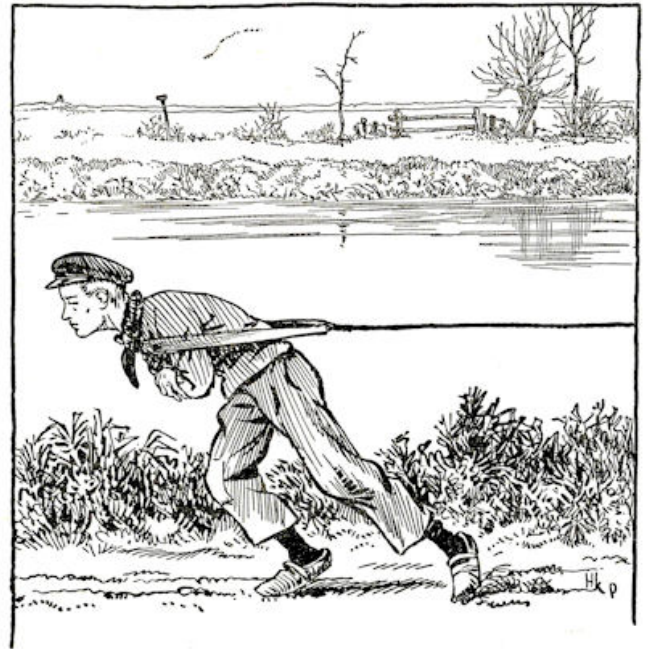
Voorovergebogen in de zeel sijkte Jelle Tjakkens langs het hard bevroren jaagpad.