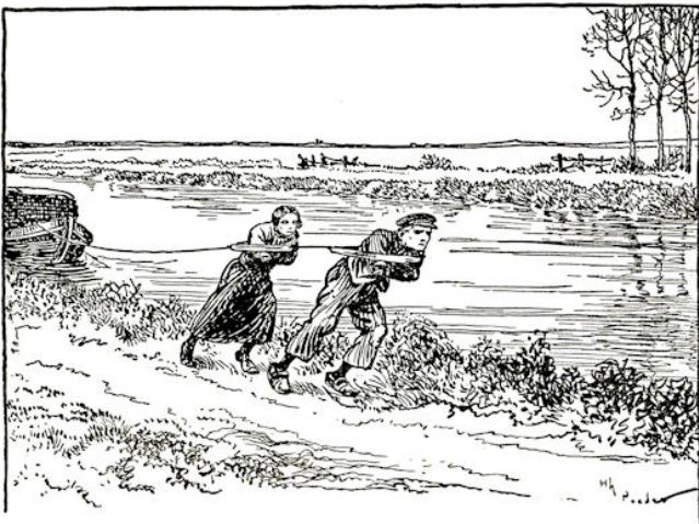
Hij en Houwkien bogen weer in de zelen ....