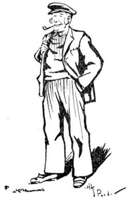
Wat een aardige man was het!