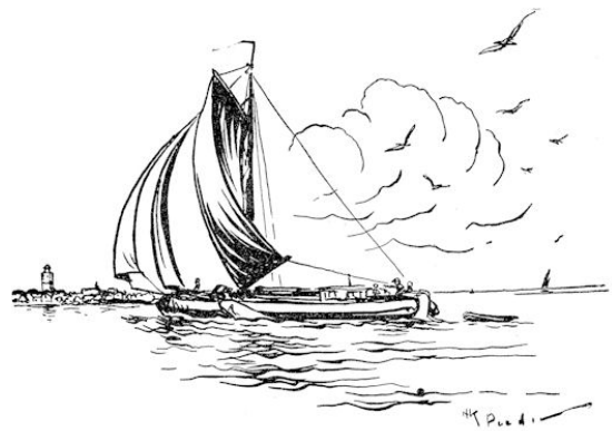
„Dat is nu Oost-Terschelling,” zeide de schipper.