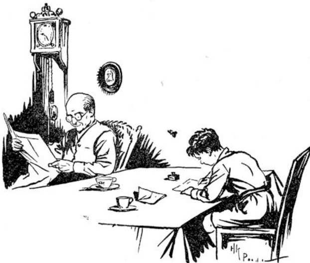
Grootvader zat met de krant en hij schreef.