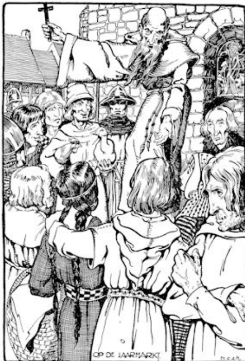
OP DE JAARMARKT