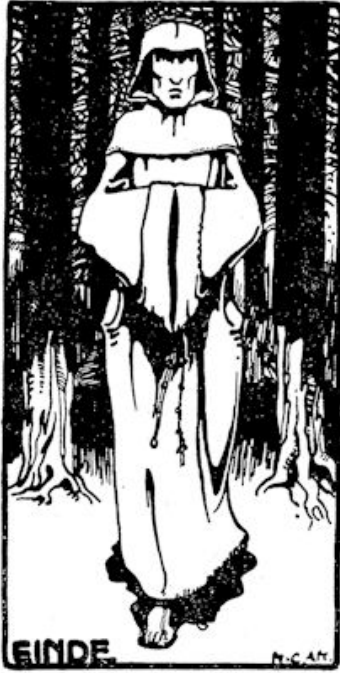
op weg . . . . naar mijn klooster