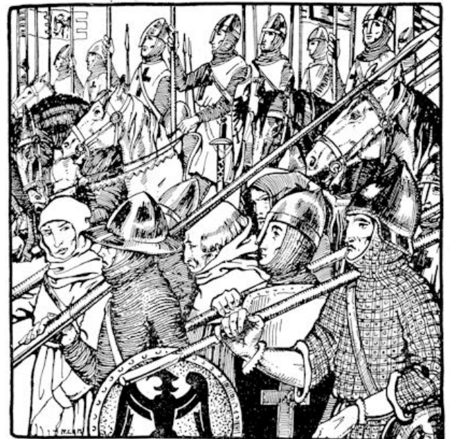
Door onbekende streken trok het leger