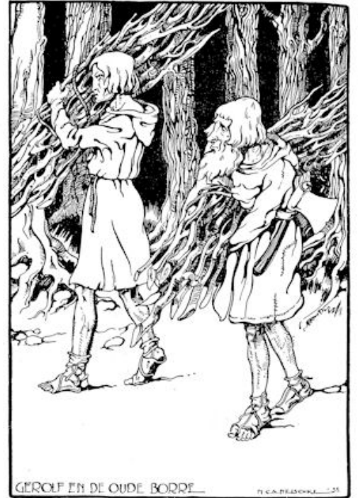
GEROLF EN DE OUDE BORDE