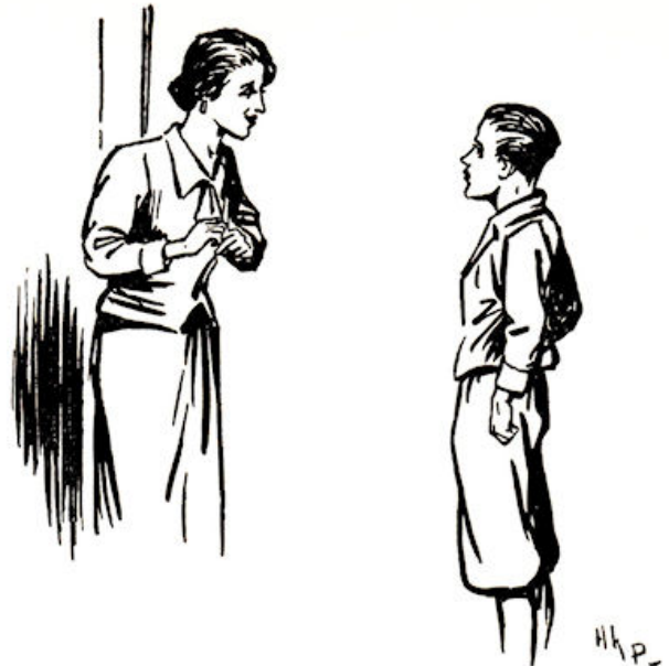
„Dag vent” zei ze vriendelijk.