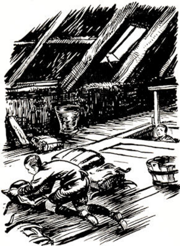
Jaap was aan het snuffelen....