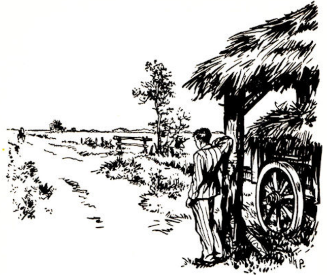
Cor bleef maar staan kijken.... (blz. 126)