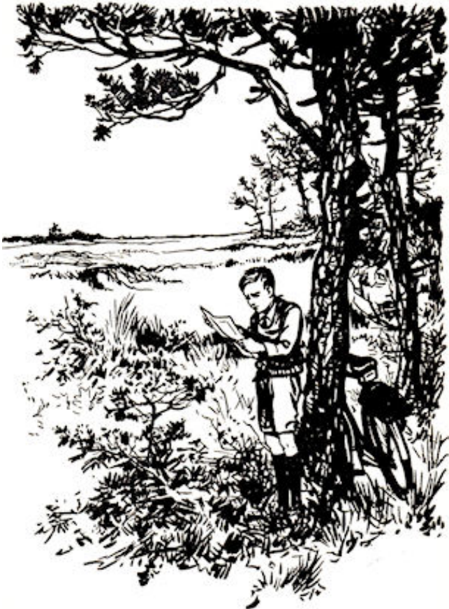
Hier achter dit groepje bomen. Zo, en nu eens kijken. (blz 111)