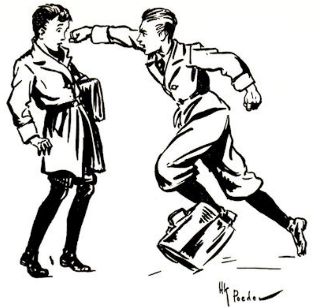
Raakte Cor precies tussen de ogen.