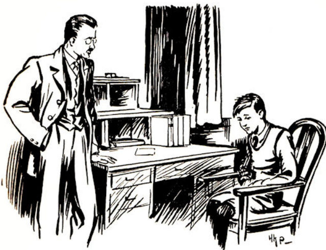
Cor keek strak naar de grond.