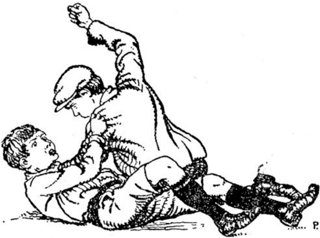
Twee jongens vechtend over den grond.