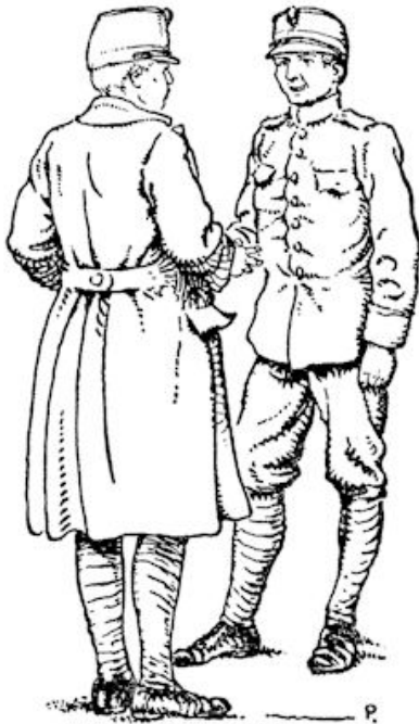
De Fries zag verrast op.