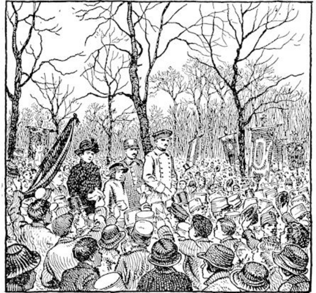
Huldiging op het Malieveld.