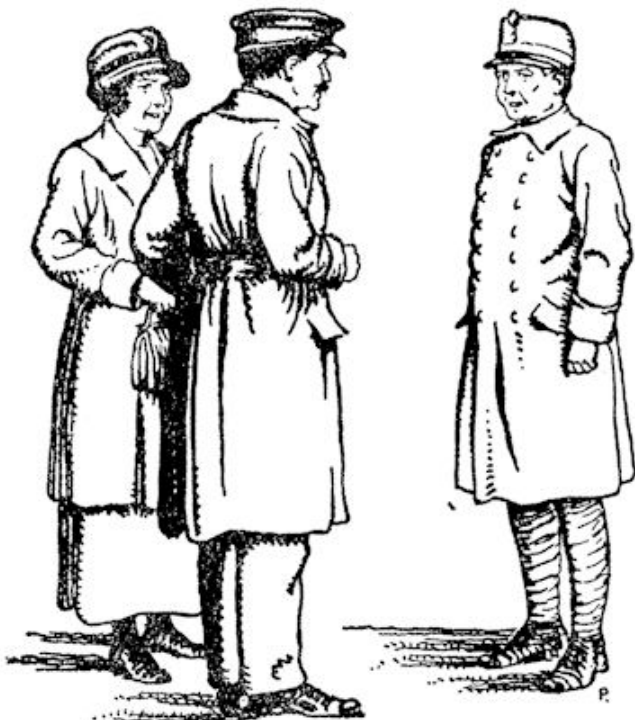
Overdiep, z'n vrouw en militair.