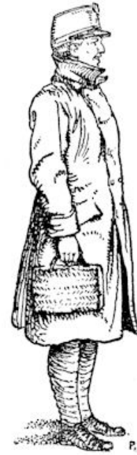
„G'navond!” groette hij.