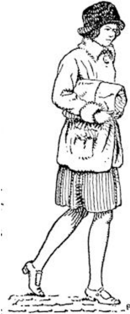
Liep daar Bets Overdiep niet?