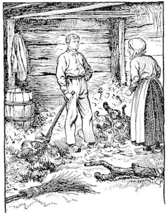
Nou, daar kwam moeke me opzoeken.