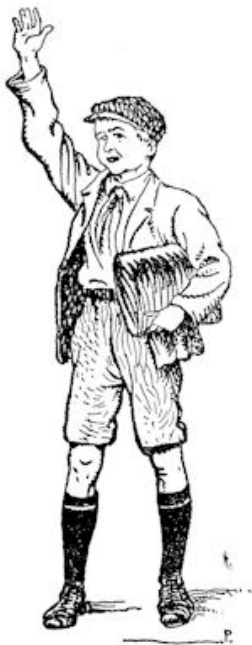
Leo stootte een doordringenden kreet uit.