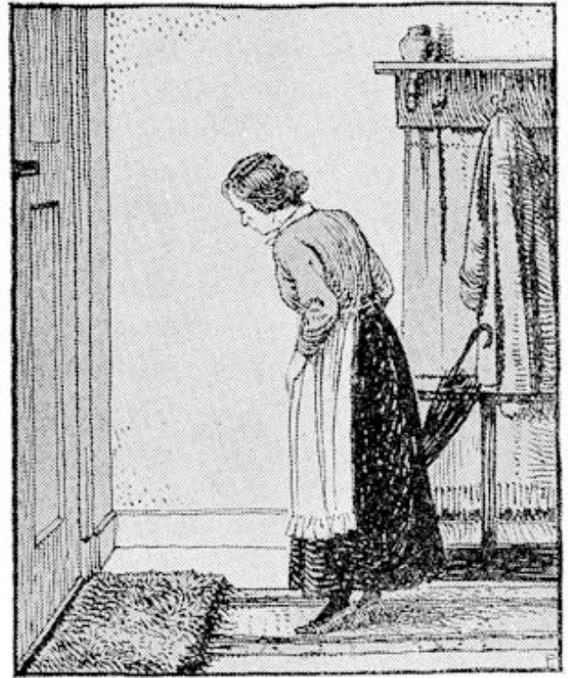
Voor alle zekerheid liep ze tot vlak bij de voordeur.