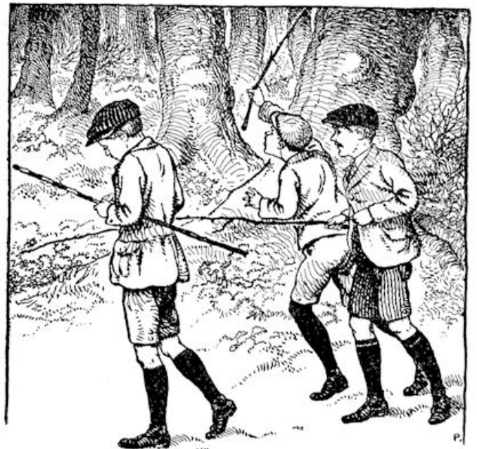
Daarom waren ze betrekkelijk vroeg weer op huis aan getrokken.