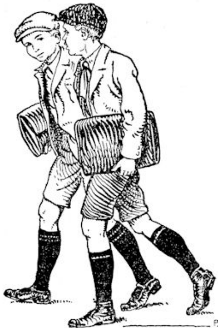
Dan loop ik zoover met je mee.