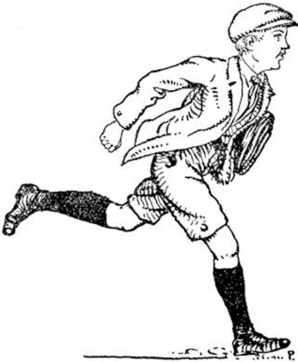
Leo hólde naar huis . . . .