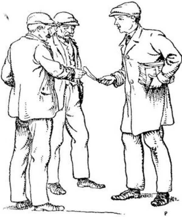
Hij stak er den metselaar een toe.