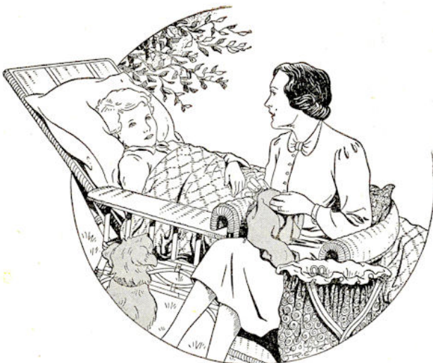
Me-vrouw Brons zit dik-wijls met haar naai-werk bij hem.