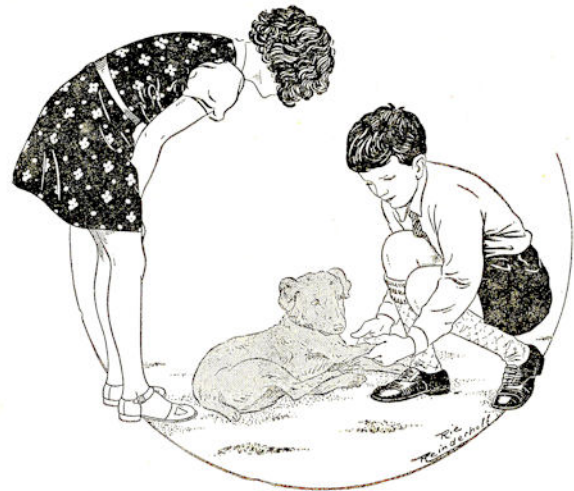
Wim knielt bij de hond neer, be-kijkt 't poot-je en zegt: „Arm dier, dat zal je pijn doen.”