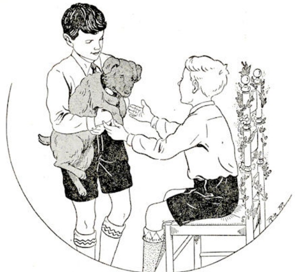
En wat heeft hij daar in z'n ar-men. Pol-ly, met een nieu-we hals-band om.