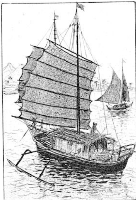
die van den kimalaha bleef op eenigen afstand liggen. blz. 40.