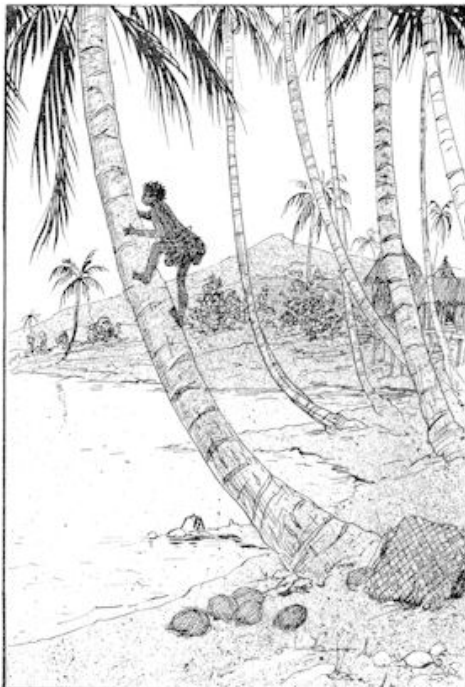
Als een aap klom hij de hoogste klapperboomen in. blz. 11.