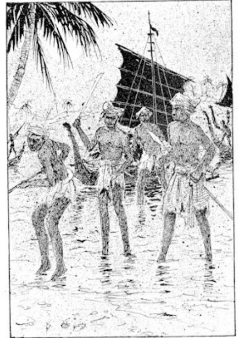
Bo zag er wel vier bij elkaar. blz. 25.