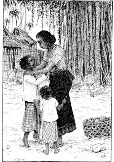
Bo voelde zijn moeders armen om zich heen. blz. 119.