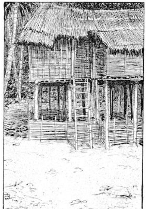
Bo's moeder begreep dadelijk, dat de jongen de trap niet had ingehaald. blz. 14.