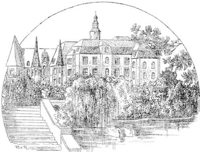
Het huis van Adelsberg.