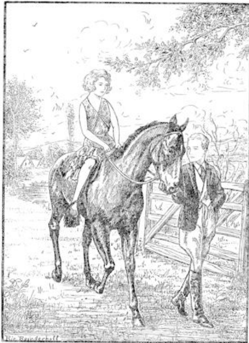
— Laat me toch eens draven! riep ze ongeduldig.