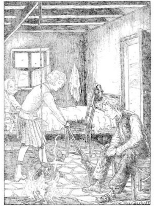
— Ga een beetje op zij, commandeerde zo Achilles, zoo kan ik niet vegen onder je stoel.