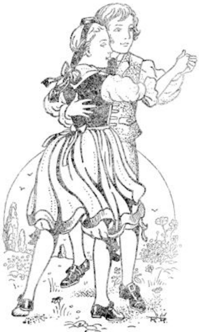
... dat gesprng van boerenkinde- ren kon ze zich best voorstellen.