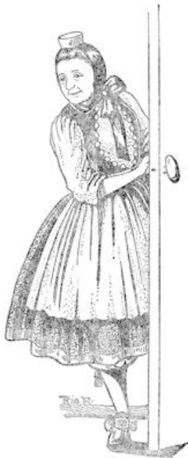
...en kwam er een vrouw binnen in de dracht van het dorp...