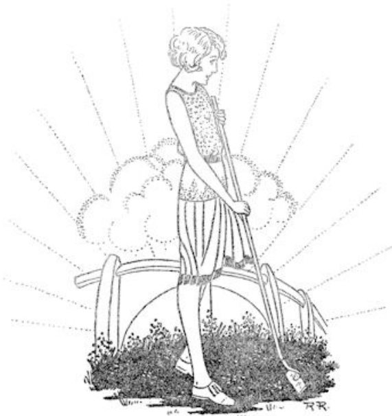
Toen ze in de stilte van den vallenden avond stond te wieden...