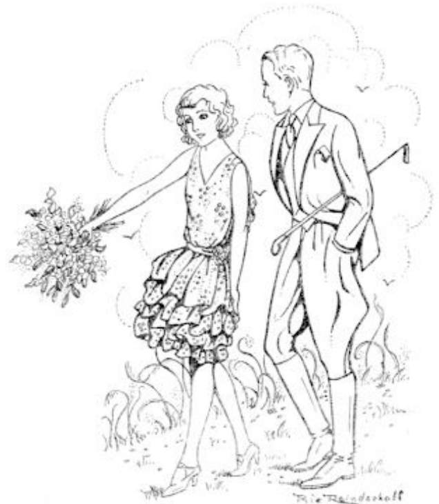
— Heb je ooit zoiets moois gezien? vroeg Hetty, de bloesems een eind van zich afhoudend.