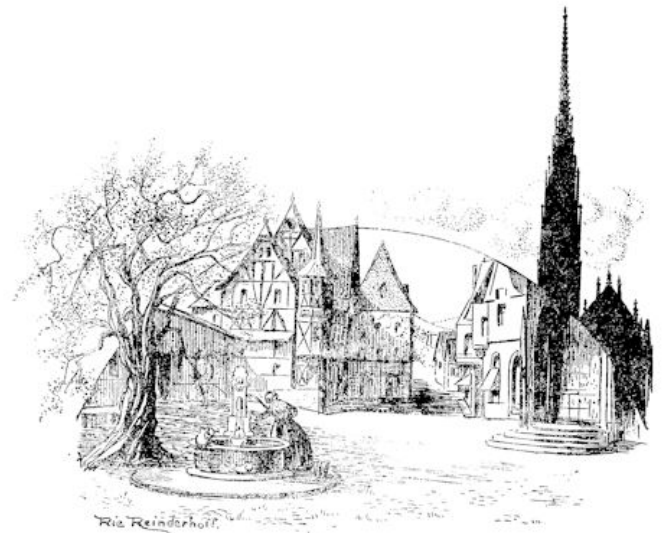
Midden op het pleintje stond een Gothische kerk met een prachtige spitsen toren, fijn teekende het steenen kantwerk zich af tegen de avondlucht. In een kring er omheen stonden oude huizen, . . .