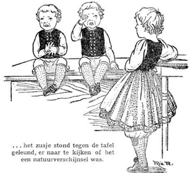
... het zusje stond tegen de tafel geleund, er naar te kijken of het een natuurverschijnsel was.