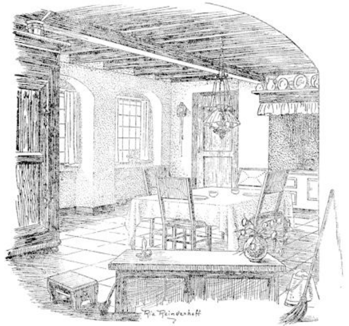
De gezellige groote keuken van de pastorie.