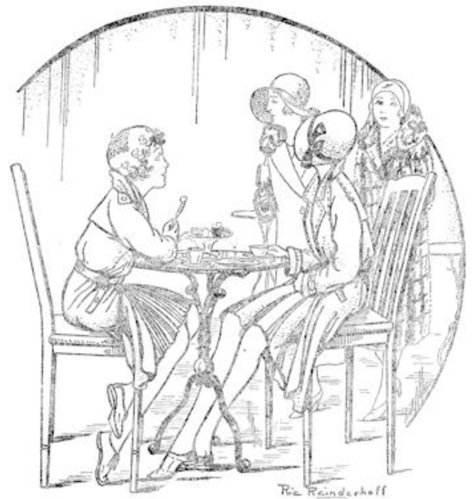
Verstrooid keek Hetty naar twee dames, die waren binnengekomen en zochten naar een tafeltje.