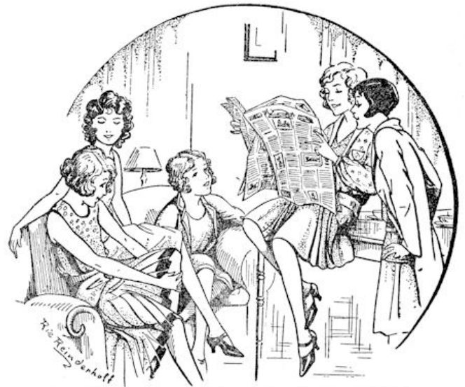
Maar 't kringetje vriendinnetjes, waar Hetty zich bij aangesloten had, las wél voor onder elkaar.