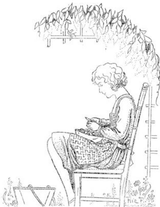
Hetty zat alleen in het priëltje aardappelen te schillen . . .