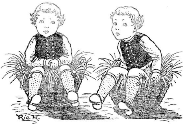
Een paar minuten later zat elk van de jongens doo- ernstig op een mand met hooi...