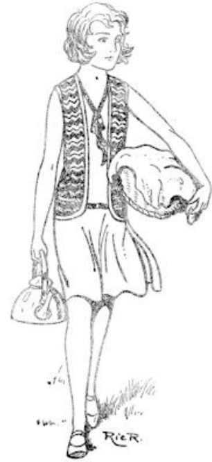
Hij zag Hetty tweemaal daags koffie en brood brengen aan de werkers.