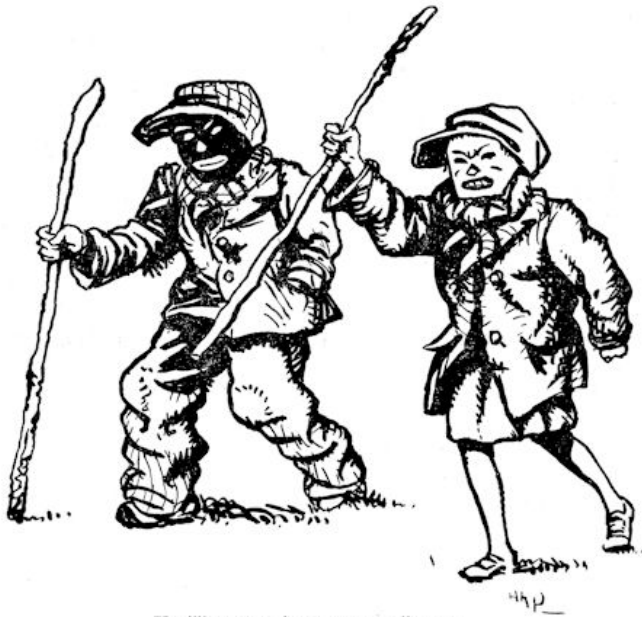
Nu lijken ze wel een paar struikrovers.