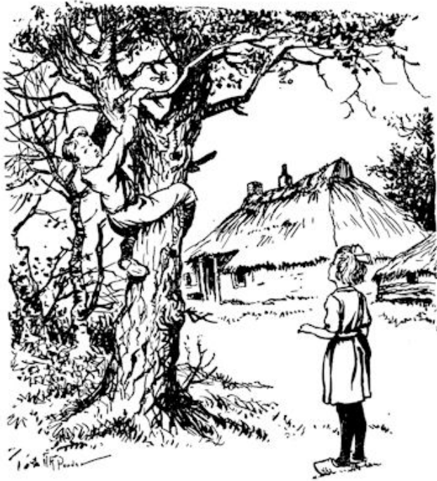
Daar heeft hij al een tak te pakken... (Zie blz. 32).