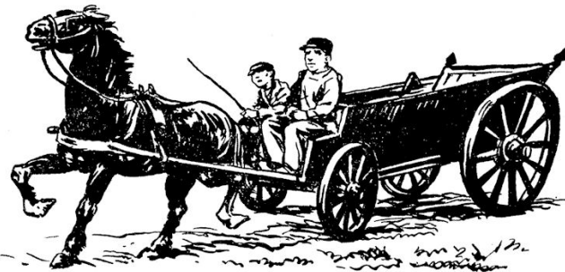
En nu op een drafje!