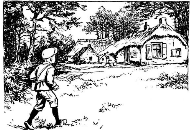
... daar middenin staat het boerderijtje van Rienks ouders.