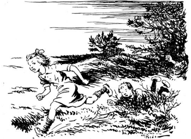
Corrie stuift hem voorbij.