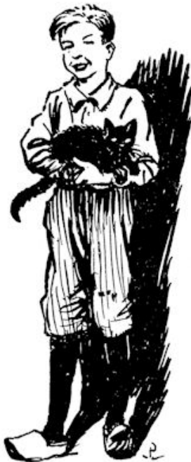
Ja, wat heeft hij daar op zijn arm? De kat!