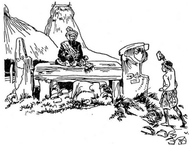
Een Bijbeise geschiedenis, gedrukt in eigen taal.