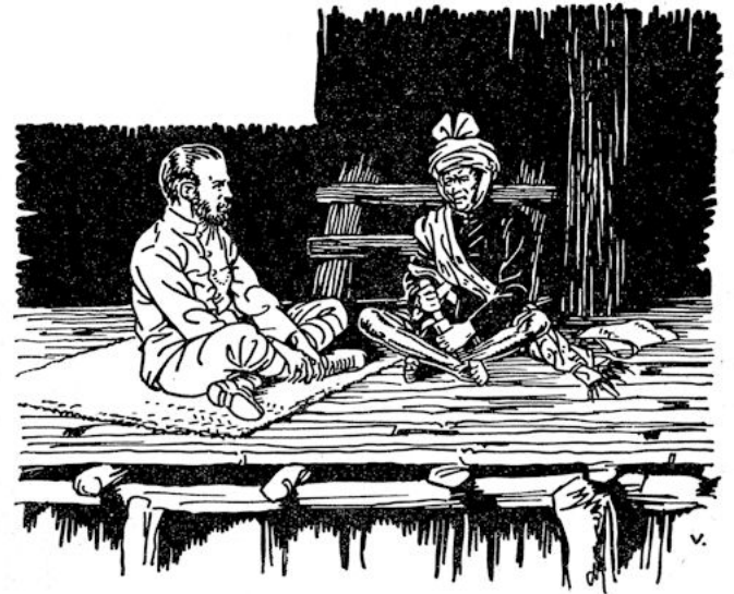
Morgen zullen vergaderen de grote vaders....