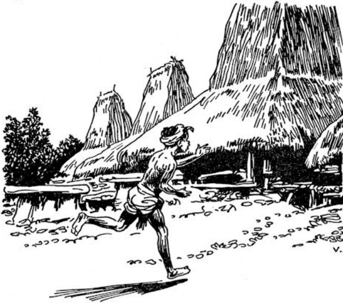
Daar komt hij, de witte man.