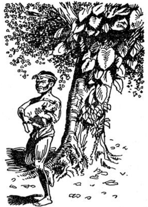
Een had zelfs een klein varkentje meegebracht.