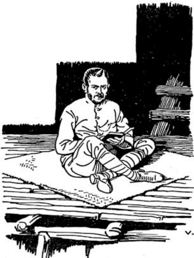
Dat grote boek spreekt, hoe lief God ons heeft gehad.