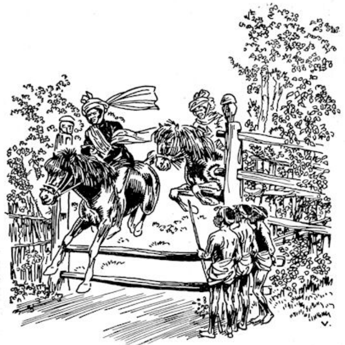
...stond Bakoe met enige vrienden te kijken.