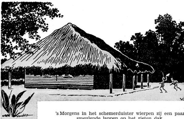
's Morgens in het schemerduister wierpen zij een paar smeulende lappen op het rieten dak.