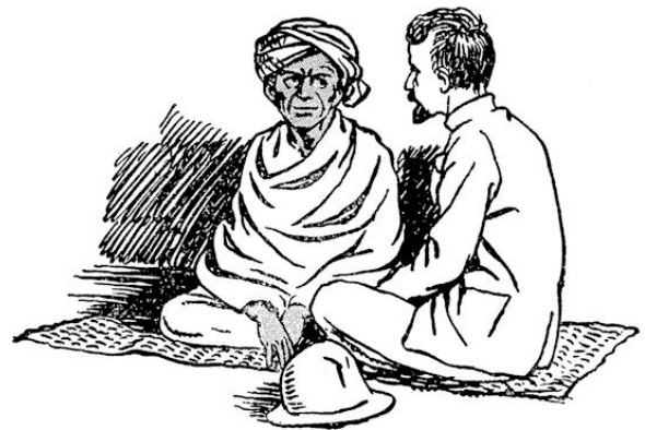
Naast hem, op een uitgerold matje, zat de zending.