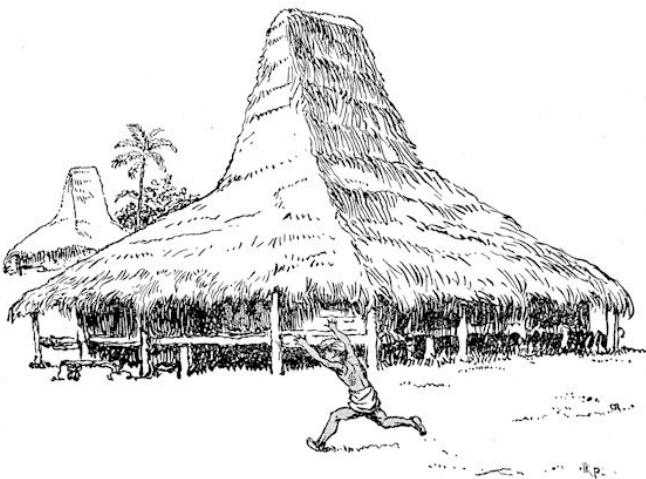
.....Daar komt hij!.....