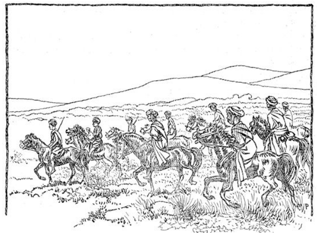
trok Oemboe Likoe met een tiental mannen te paard naar het stamdrp.