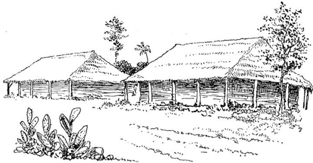
School en onderwijzerswoning.