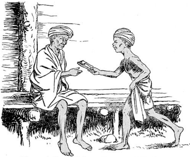
„Hier vader”, zei Bakoe, „is nu een klein boek,