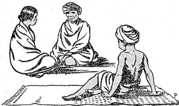
Bakoe, die dichtbij op zijn slaapmatje lag, ging overeind zitten.