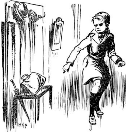
Met een verongelijkt gezicht gooide Kees z'n tas in de parapluiebak. „Die lui hebben nou toch ook altijd wat!