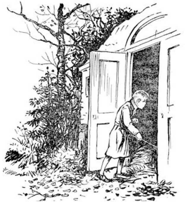
Kees keek eens in de stal, maar daar was weinig te zien. Het stro lag er als altijd, hoogstens leek het in de ene hoek een beetje plat. Alsof er iemand geslapen had. . . .