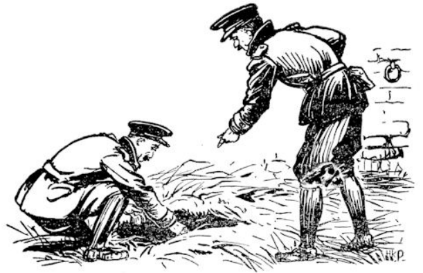
We zijn gaan kijken zodra 't licht was de volgende morgen en hoewel ze ons de bergplaats nauwkeurig hebben aangeduid, viel het nòg niet mee om hem te vinden.