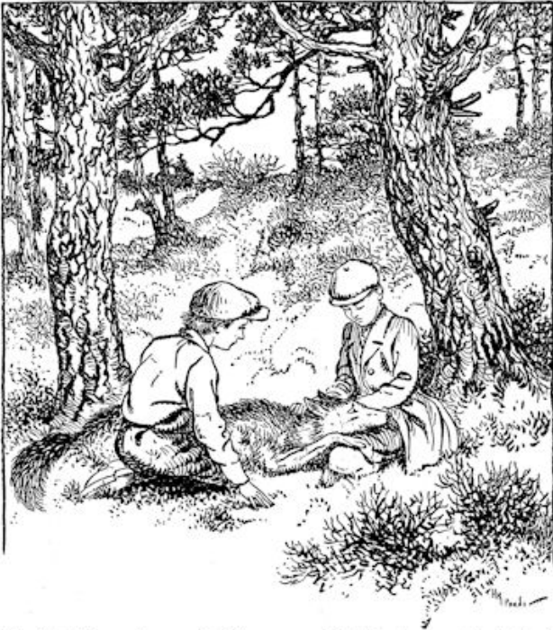
Wim liet zich op de grond glijden en nam Turk z'n kop op schoot. blz. 51