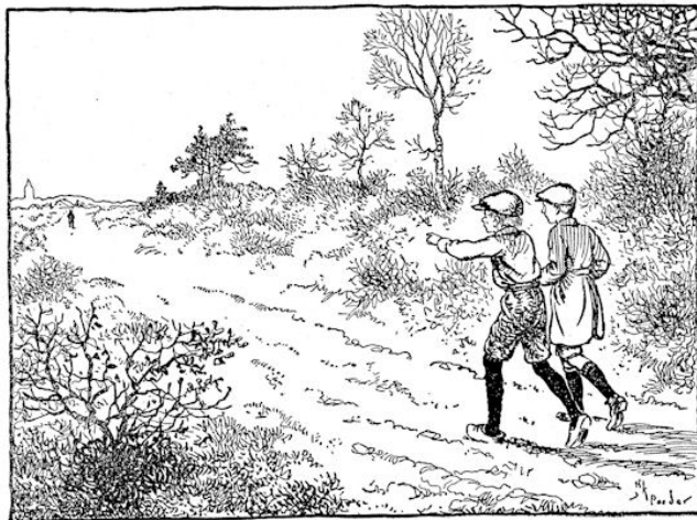
Toen ze vlak bij 't dorp waren, zagen ze Gijs....