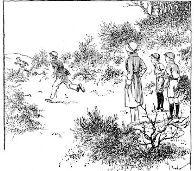
Maar Evertsen holde hem na.... blz. 129