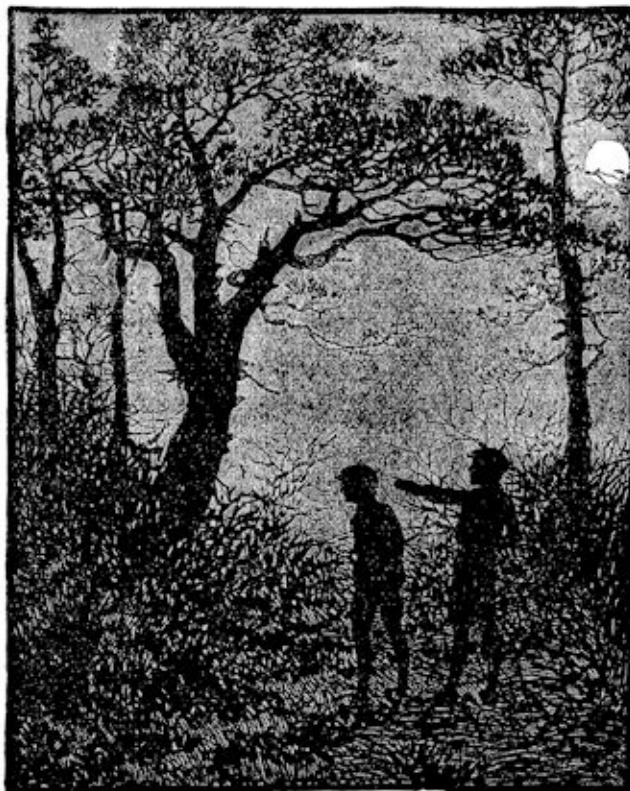
„Zie je die boom met zulke rare kronkeltakken?”