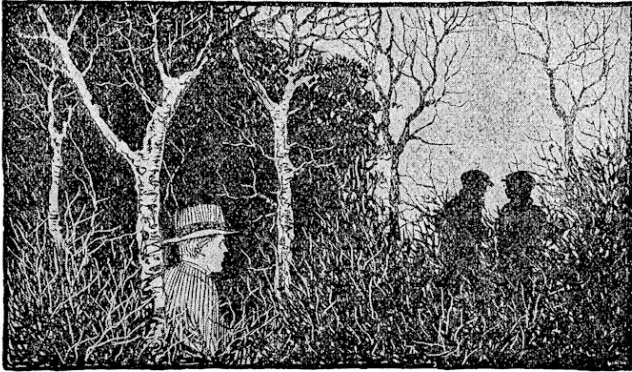
Evertsen volgde ze op een afstand. .... Blz. 123.