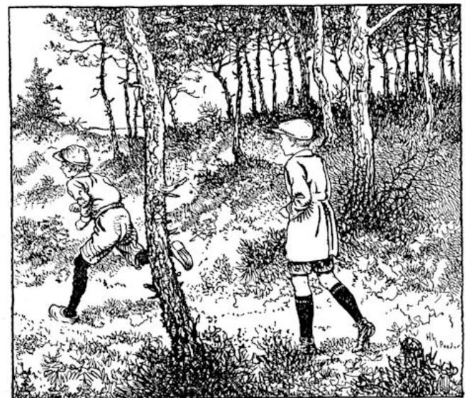
.... en meteen zette hij het op een lopen. blz. 48