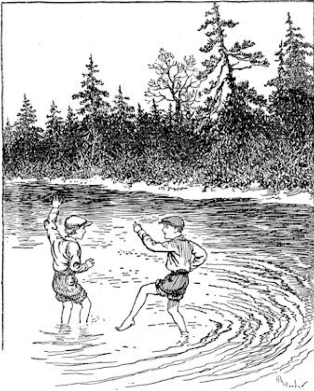
In 'n ommezien waadde hij in 't water. blz. 84.