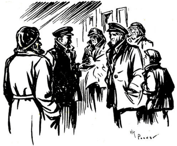
Daar kwam de chef.