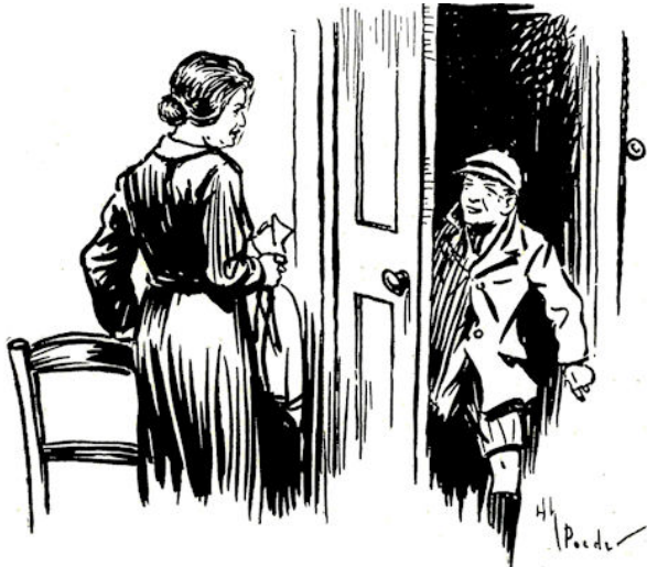
„En hoe is het gegaan, jongen?”