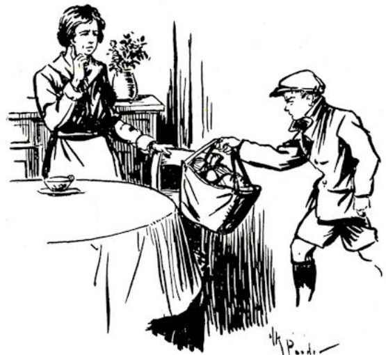
Vaak zette hij de tas met zakjes plomp op een stoel, nijdig.