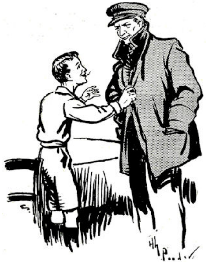
„Dan kan ik wel mee, hé vader?”