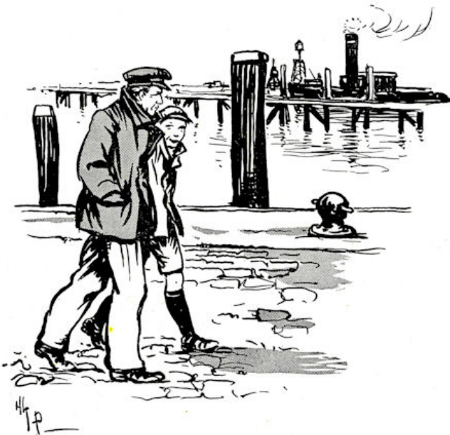
Om één uur stapten Van Dijk en Evert naar de haven.