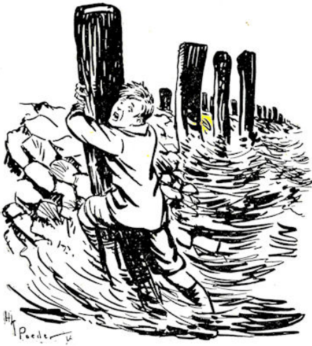
Want Koos had de knoestige stomp reeds omarmd.