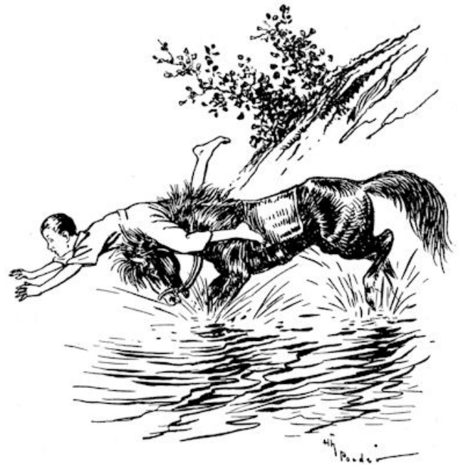
Met een kreet van: „Help, help!” rolde hij in het water.