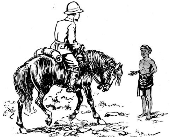
„Heer,” antwoordde Dai beleefd, „ik ga heen, van waar ik niet tot u zal wederkeeren.”