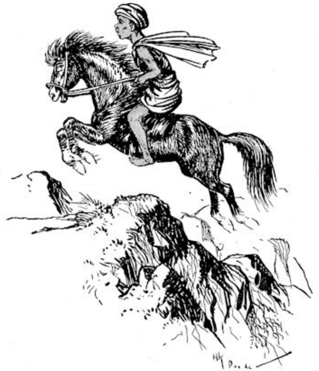
Met een laatste sprong kwam hij over de rotswand.