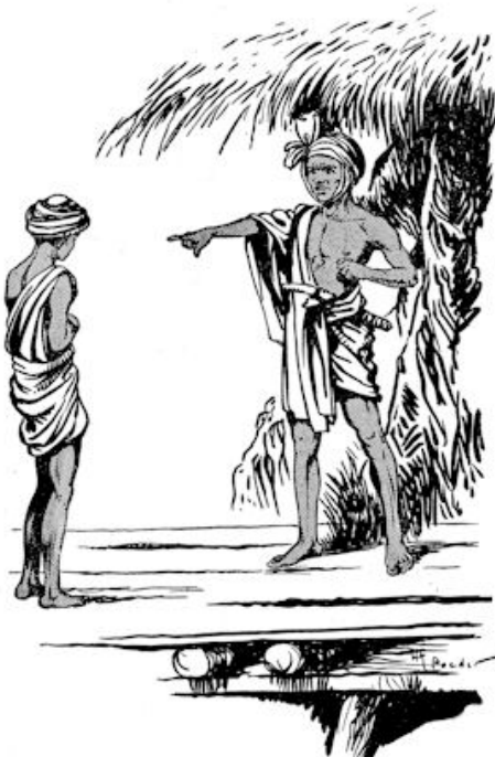
„Maar mijn vader werd zeer toornig en stond op met dreigend gebaar.”