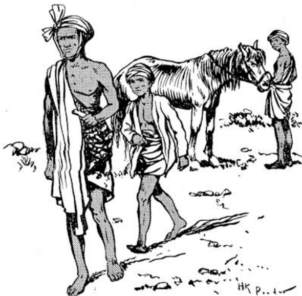
Achter den radja aan stapte parmantig de kleine Oemboc Dai.