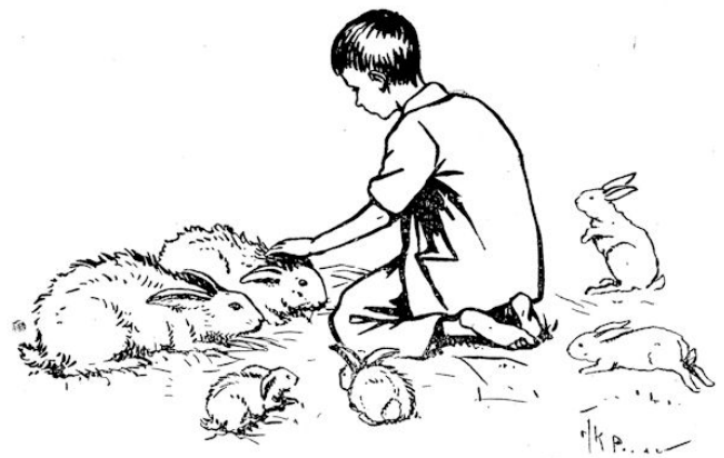
.... en lieten toe dat Guus ze streefde.