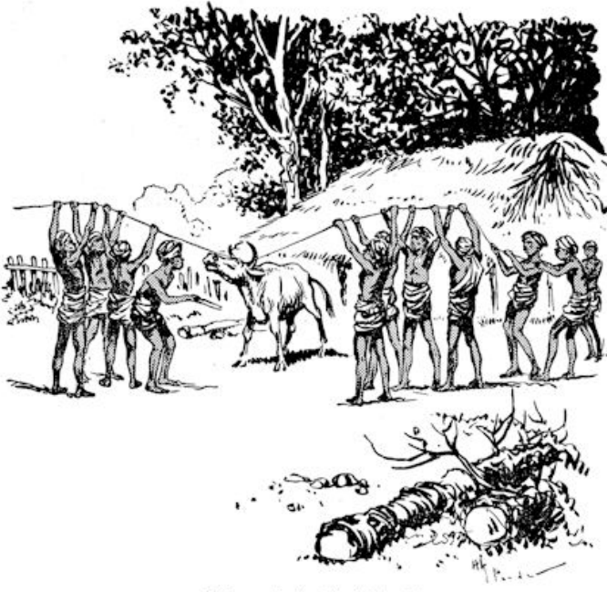
„Zijgaan de buffel slachten.”