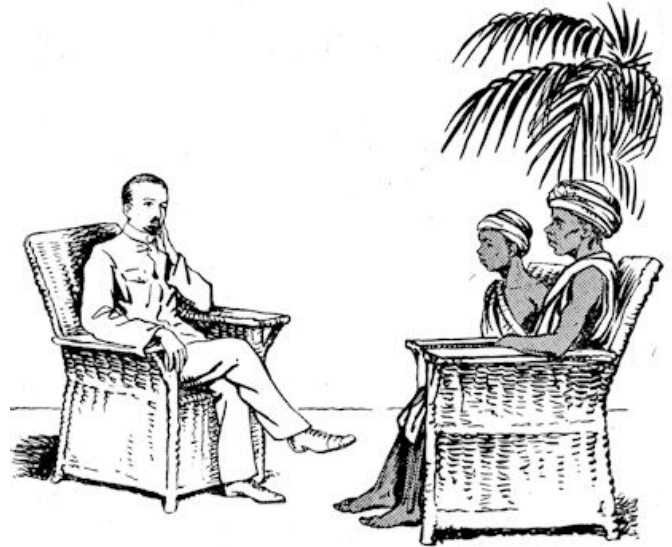
Op een rieten stoel in de voorgalerij gezeten.