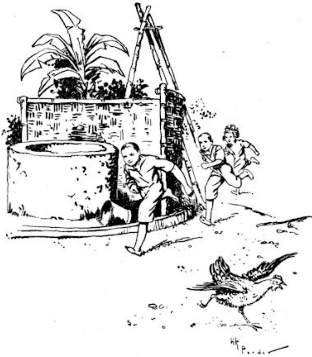
.... kwam een drietal kinderen aanrennen.