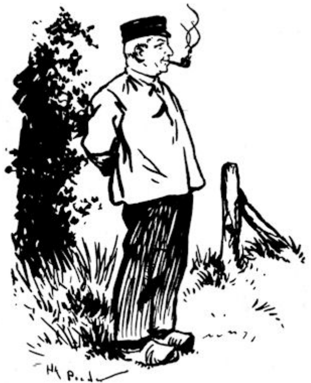
't Was een korte gedrongen gestalte. (Blz. 143.)