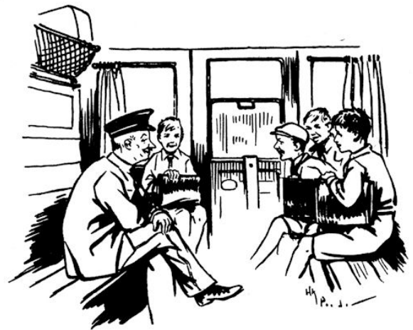
Toen vroeg ie: „Wwie d.d.deed...ddat?“ (Blz. 12.)