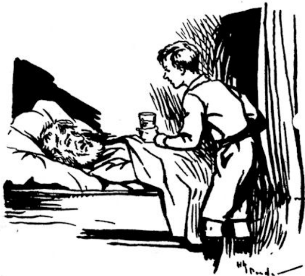
„'k Wou graag wat drinken” .... (Blz. 135.)