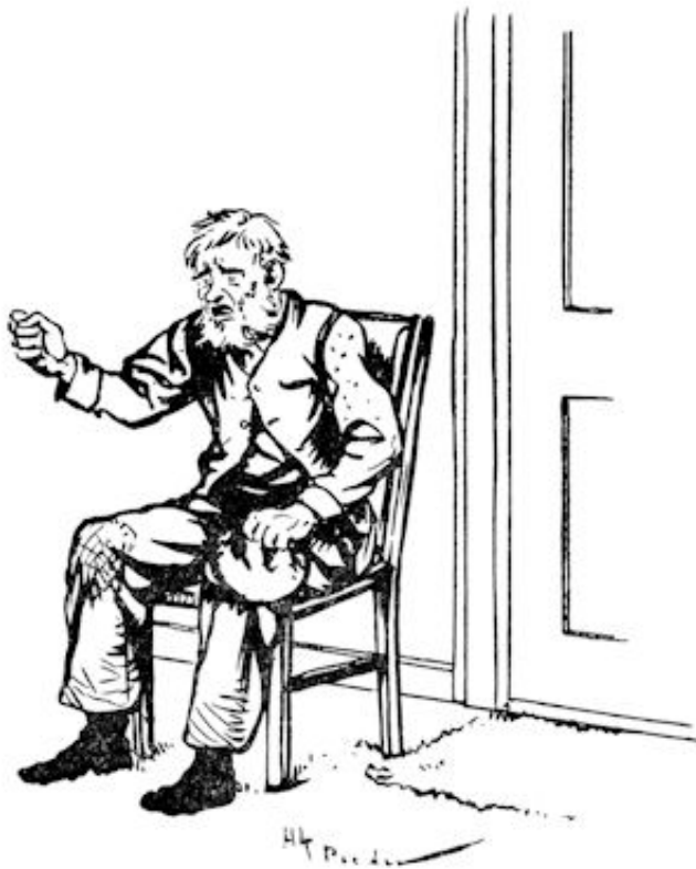
...barstte hij in tranen uit: „Ik ben onschuldig.“ (Blz. 90.)