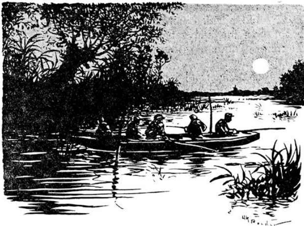
Dan dat peuren in de nacht. (Blz. 113.)