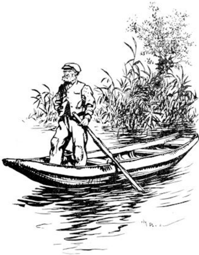
Zagen ze in een roeiboot een zwaar gebouwden kerel staan met grijze baard en norsch uiterlijk. (Blz. 73.)