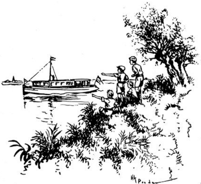
Statig voer het voorbij. (Bldz. 17.)