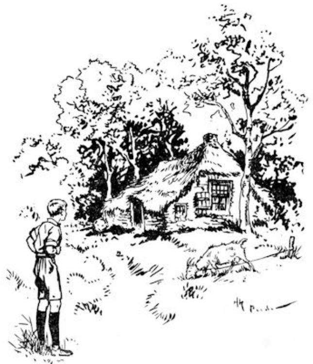
Die geheimzinnigheid werd verhoogd door de vervallen toestand, waarin het verkeerde. (Blz. 65.)