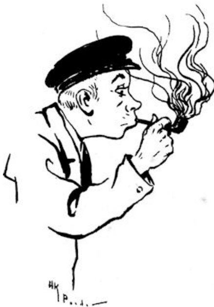
De stuurman deed een geweldige haal. (Blz. 35.)