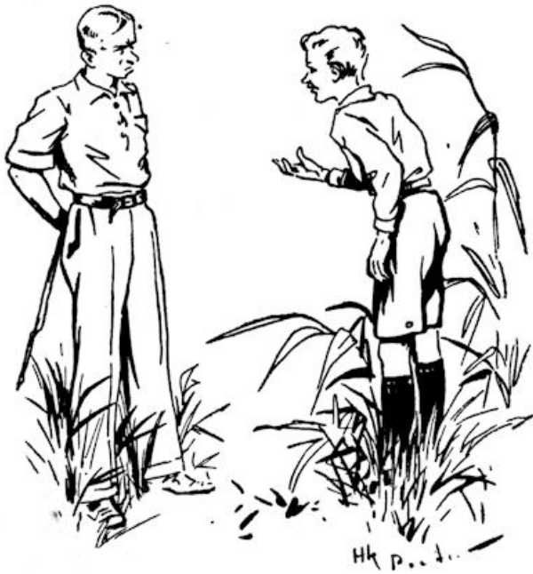
„Goeden avond mijnheer”. (Blz. 46.)