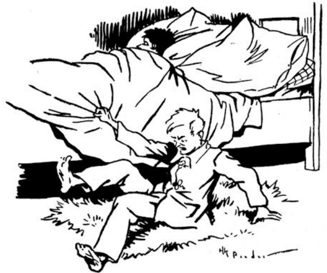
Toen werd ie wakker en ontdekte dat hij naast z'n ledikant lag. (Blz. 24.)