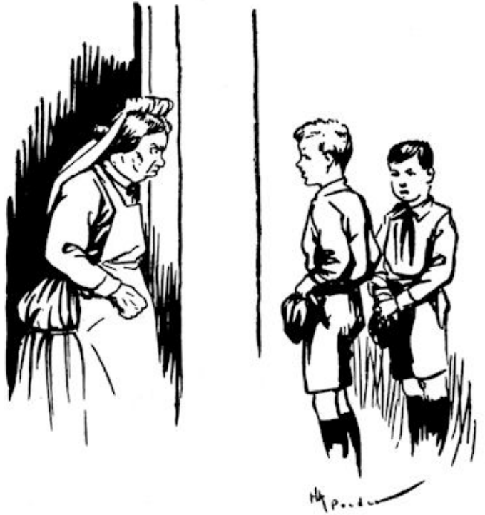
Wat motte jullie? (Blz. 123.)