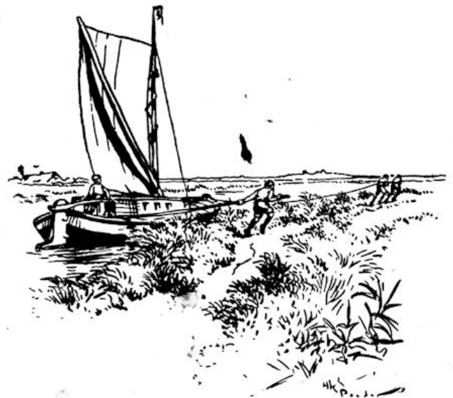
De trekkers zetten gang, de lijn spande zich. (Blz. 40.)