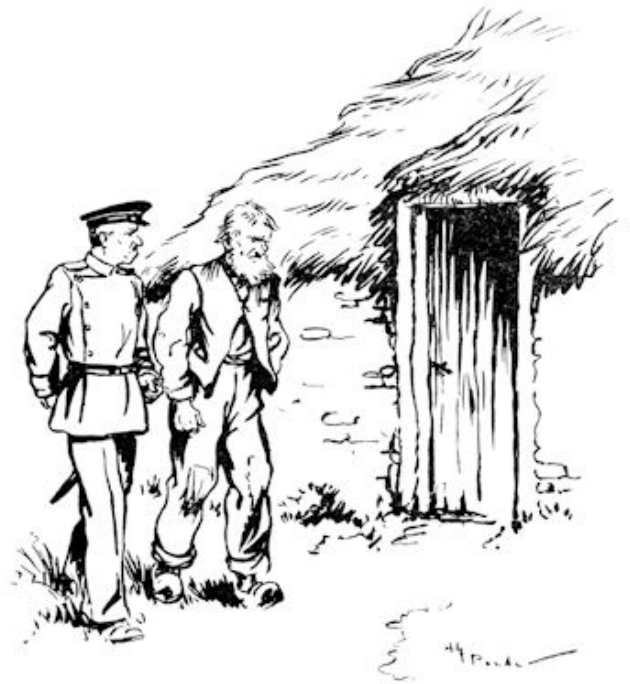
Intusschen kwam Bart met nog een politieman. (Blz. 85.)