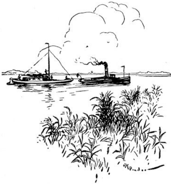
...zwarte rookwolken komen uit de pijp van de stoomboot, en langzaam, langzaam aan varen ze weg. (Blz. 27.)