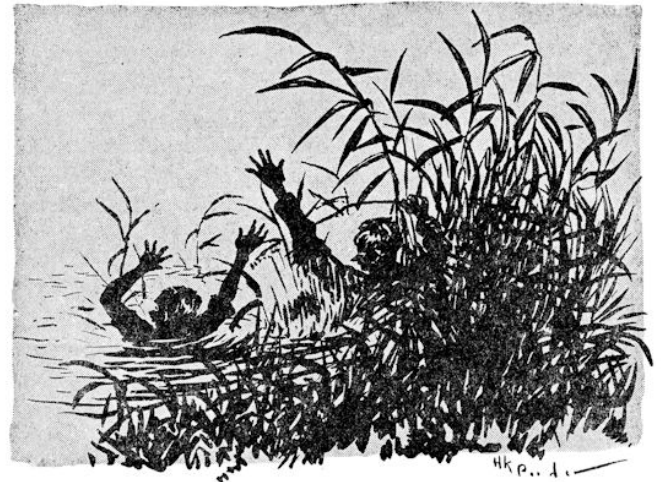
Een plons en nog een plons. (Blz. 51.)