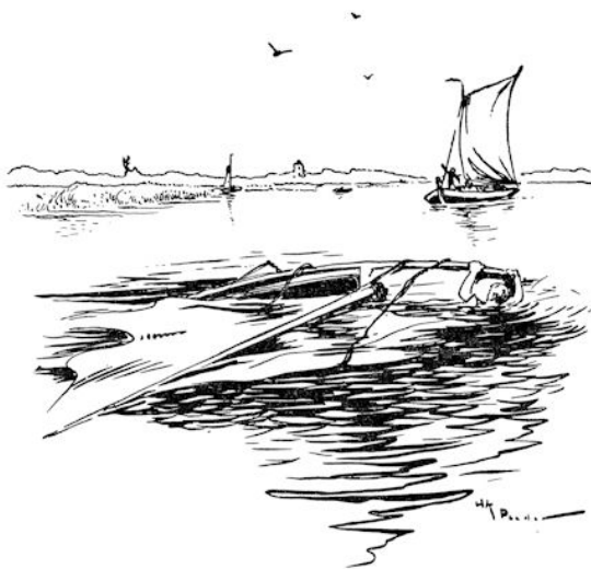
Plotseling was het zeil losgeschoten en in een oogenblik was het ranke bootje gekanteld. (Blz. 59.)