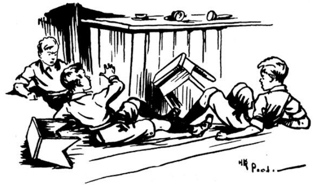
De drie jongens tuimelden van hun lage tabouretjes en rolden door elkaar. (Blz. 32.)