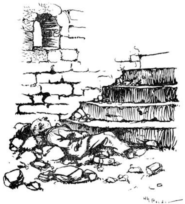
Zagen ze iemand liggen. (Blz. 98.)