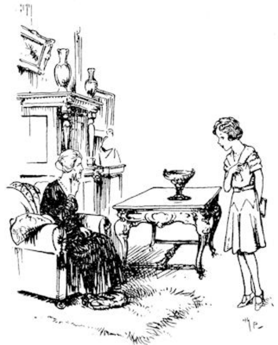
„Zoo, heb je het dan zoo druk, dat je niet eens vijf minuten met je oma kunt praten?”