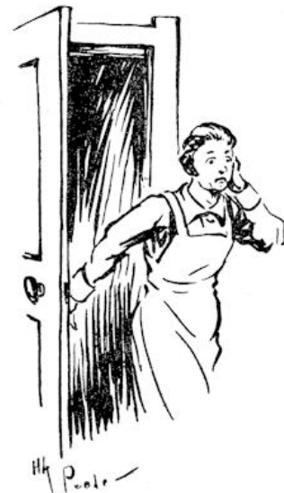
Maar dan opeens — voetstappen in de gang, de deur vliegt open —