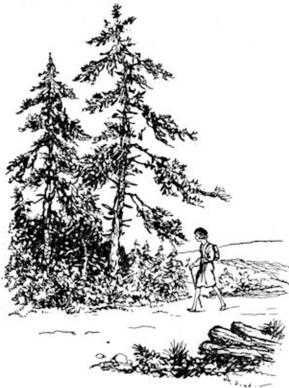
Ze liep maar verder, al maar verder.