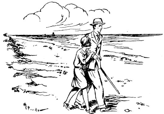
Op die lange wandeling langs het strand vertelde hij het haar.