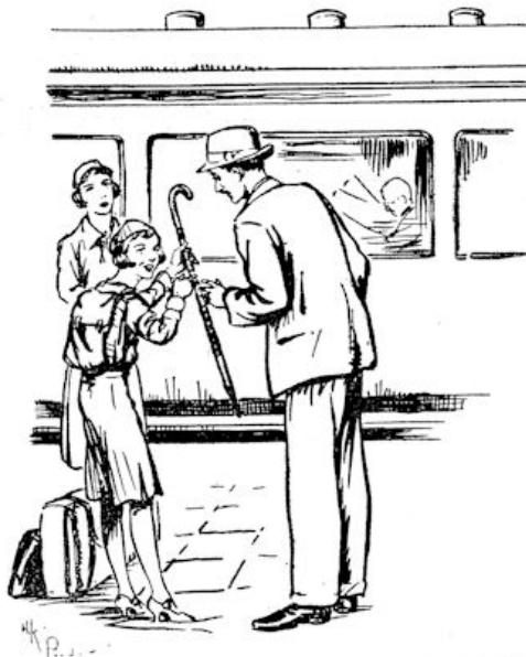
„Ziet u wel, dat die vol plaatjes zit? Kijk eens.“