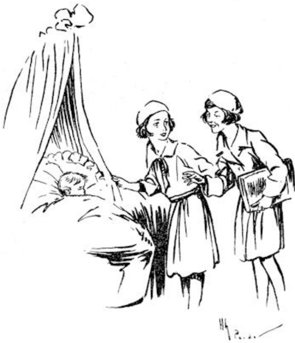
Ze keken maar ...