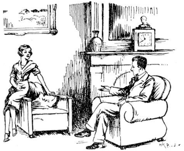
Maar ze hield zich, of ze zijn vraag niet begreep.