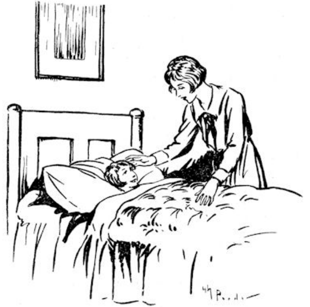
„Ga jij maar vast slapen. Wel te rusten.“