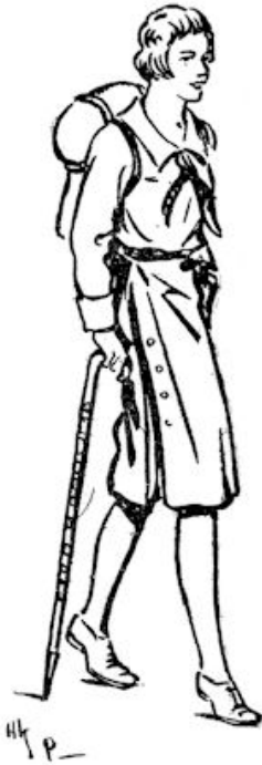
„Wat zag die er grappig uit.“