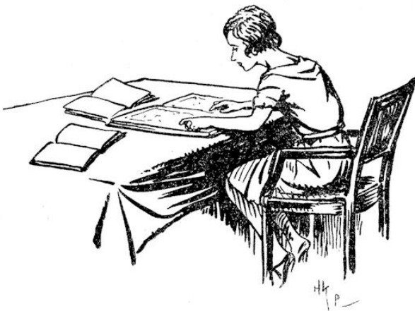
Ze zat nu met die kaart voor zich.