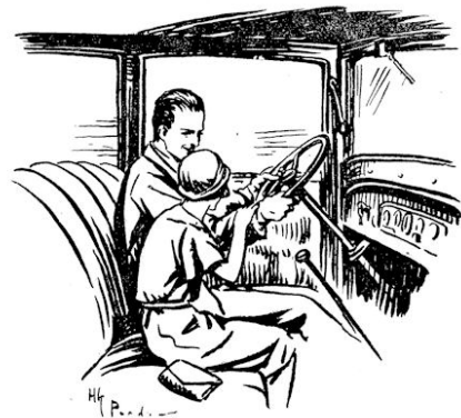
„Vader,” zei ze, „ik vind het toch zoo eenig, dat wij gaan.”