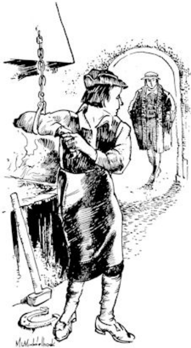
Wat moet die vreemde suiter van hem?