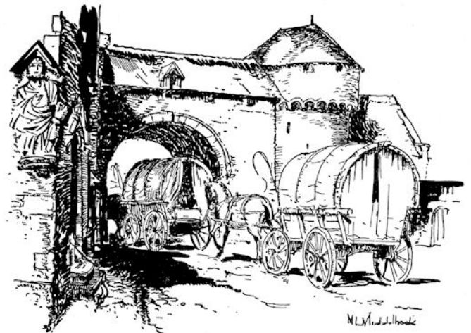
... reden er drie wagens de poort van Buda uit.