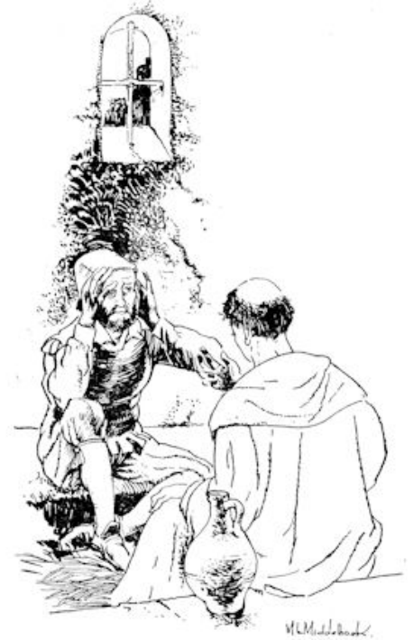
„Wat zeg je daar?”