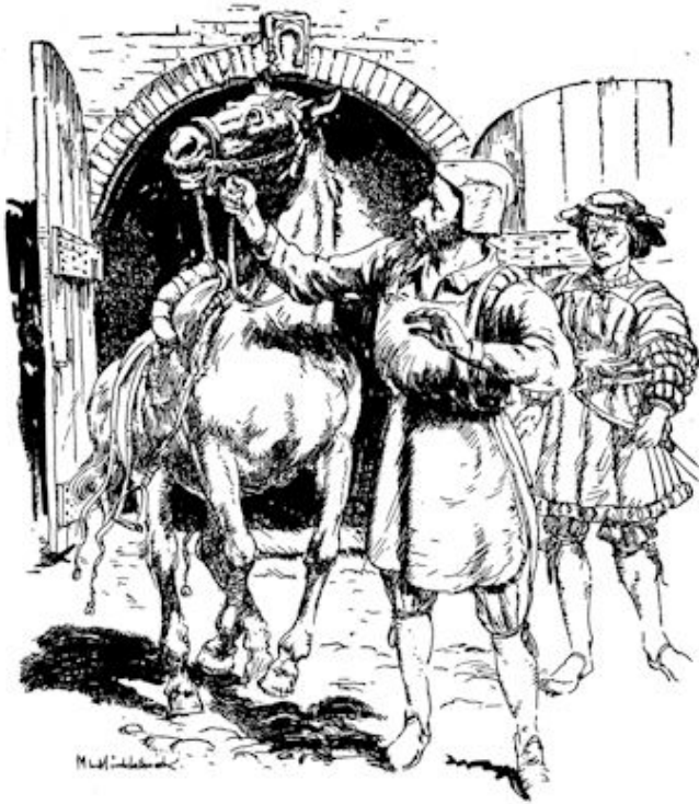
Voorzichtig leidde hij het dier uit de hoefstal (Zie blz. 62).