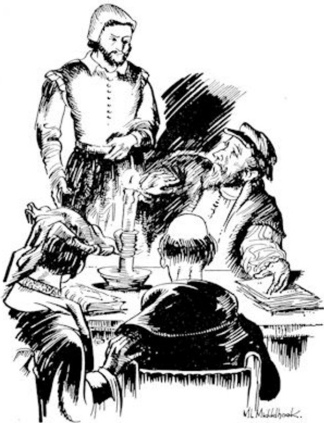
Vóórdat de heren er op verdacht zijn, staat de hoefsmid voor hun tafel.