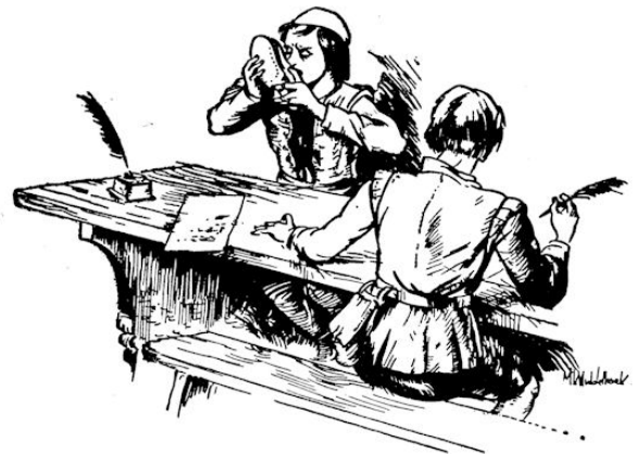
Nu steekt Ferenc z'n mond in de opening van zijn schoen . . .