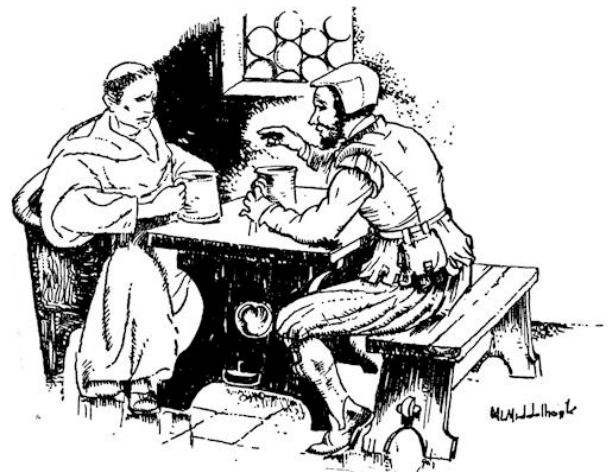
Omstandig vertelt de hoefsmid de ontdekking.