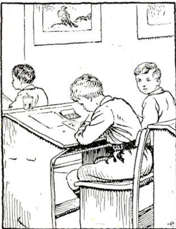
Langzaam haalde hij het penseel over het plekje.