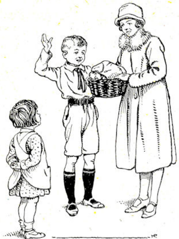
Moeder had een mandje onder de arm.