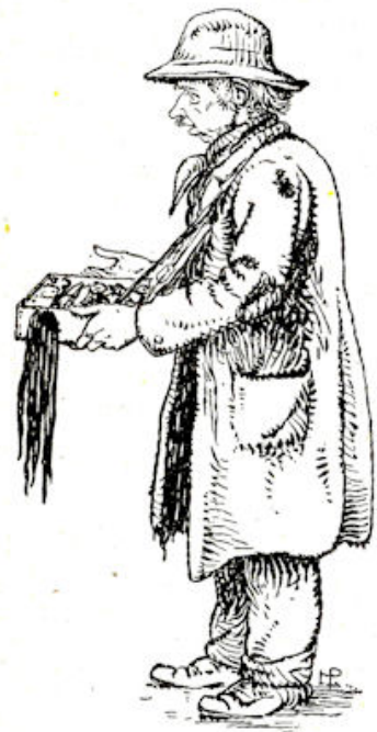
Een man stond er, met een klein kistje snorrepijperijen.