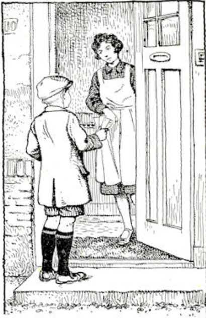
DE DEUR GING OPEN. EEN DIENSTBODE MET EEN DONKERE JAPON AAN EN EEN HELDER WIT SCHORT DAAROP KWAM VOOR. „EN . . . . ?” VROEG ZE. (Zie blz. 30).