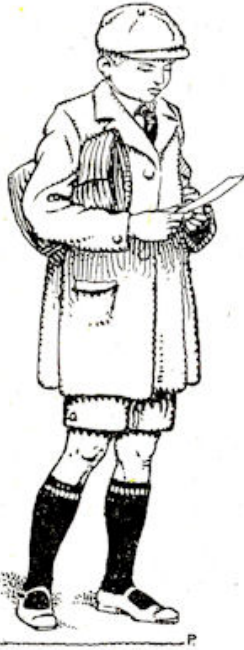
Hij bleef midden op straat stil- staan, om zijn werk nog eens te bekijken.