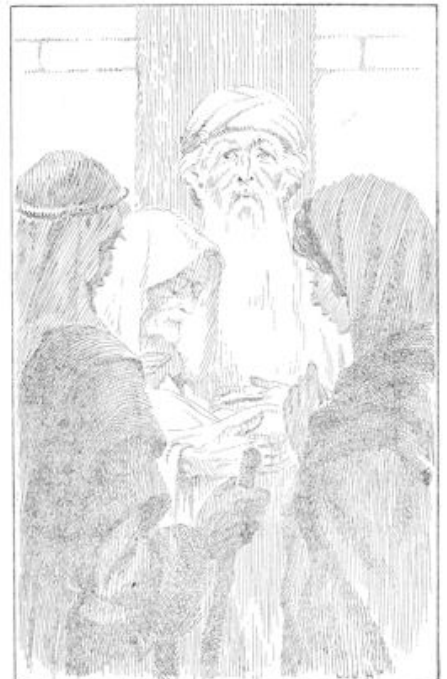
Toes kunnen er een oude man en een heel oude vrouw bij staan, die met aandacht naar het kind keken. (blz. 346)