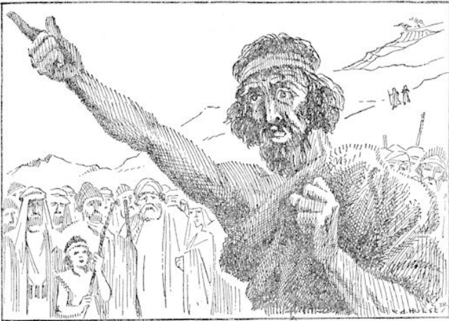
„Niets is zo indrukwekkend als zijn woorden!” zeiden zij bij hun thuiskomst. „Die man is een profet.” (blz. 365)