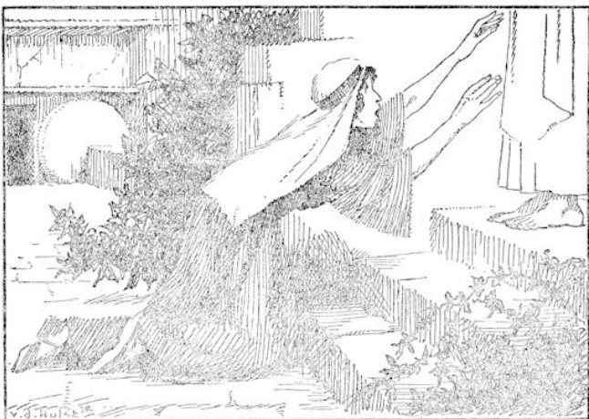
„Meester!” riep zij uit en viel aan zijn voeten neer.