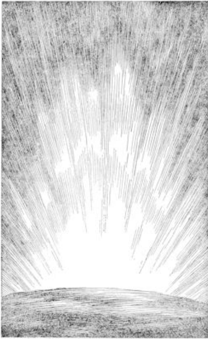
God stelde de jaargetijden in en regelde de stand van zon, maan en sterren. (blz. 6)