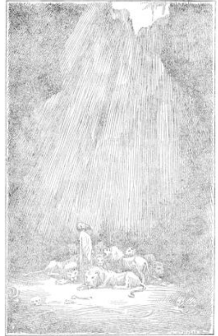
In toen de koning over de rand van de kluft naar beneden keek, zag hij Daniël staan en de leeuwen lagen rustig om zijn voeten. (blz. 304)