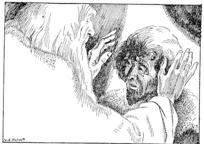
„God zegene u, mijn zoon,” zei hij, „en make u tot een rijk man en een machtig heerser.” (blz. 35)