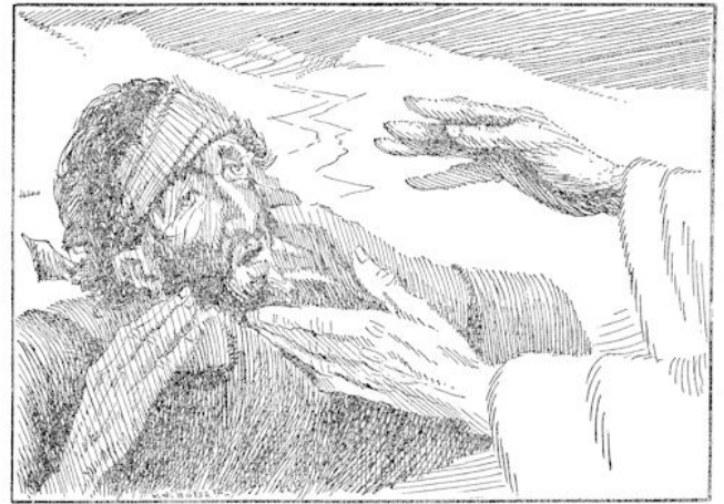
De vader had den jongsten zoon herkend. En voor de jongen tijd had zijn vader te voet te vallen en hem te smeken, hem als knecht in dienst te nemen, had hij reeds zijn beide armen om hem heen geslagen en hem gekust. (blz. 408)