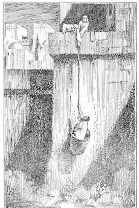
Toen zetten zij Saulus in een mand en lieten die aan sterke touwen naar beneden zakken, zodat hij aan de buitenzijde van de muur neerkwam. (blz. 540)