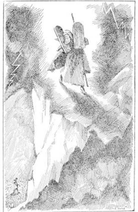
Opzet: zeg Mozes wat er aan de hand was.