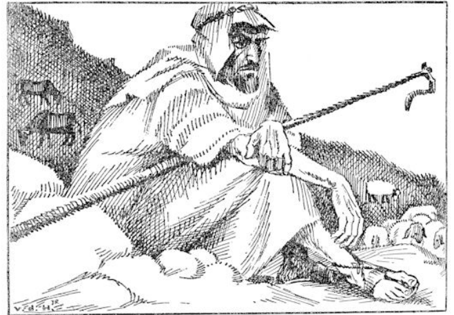
Hij was boer en hij hoedde zijn vee. En nooit was het bij hem opgekomen, uit zijn land weg te gaan of ander werk te doen dan het zijne. (blz. 187)