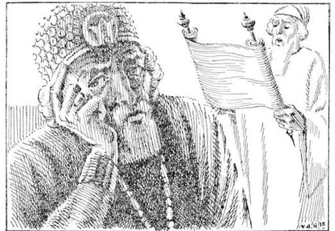
Safan begon te lezen. En hoe verder hij kwam, hoe bleker en stiller de koning werd. (blz. 220)