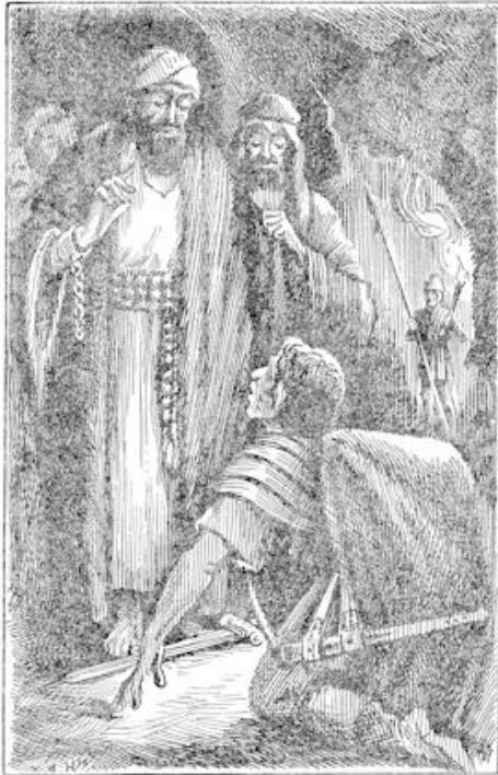
Sidderend viel de man voor hem op de knieën