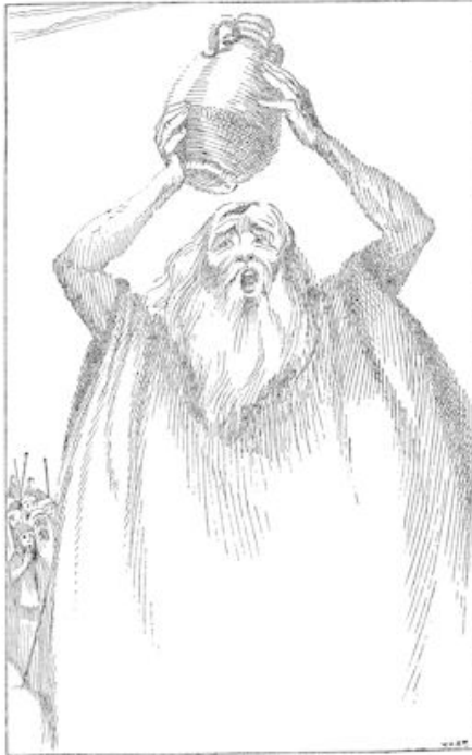
Dus bleef hij de kraai met beide handen hoog losen zijn hoofd en smet hen toen met een zware slag op de grond, zodat hij in dalend scherven uiteenspatte. (blz. 236)