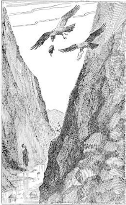
Maar Elia dronk het water uit de beek en voedde zich met brokken steen en brood, die de raven er brachten. (blz. 158)