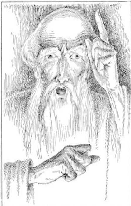
„Ja, dat weet ik,” zei Jeshin streng. (blz. 201)