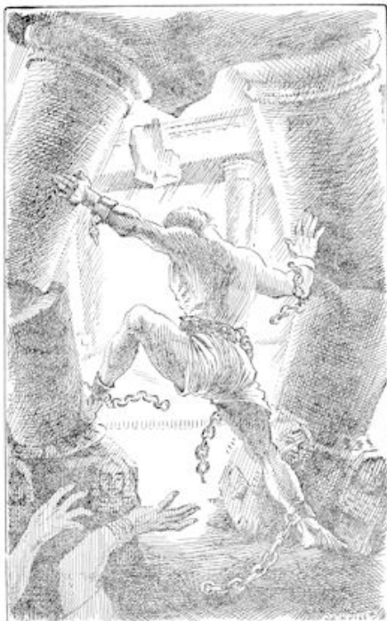
Tom hoog hij zich voorover, beet zijn tanden open en begon te drukken. Een ogenblik later stortte het dak in. (blz. 98)