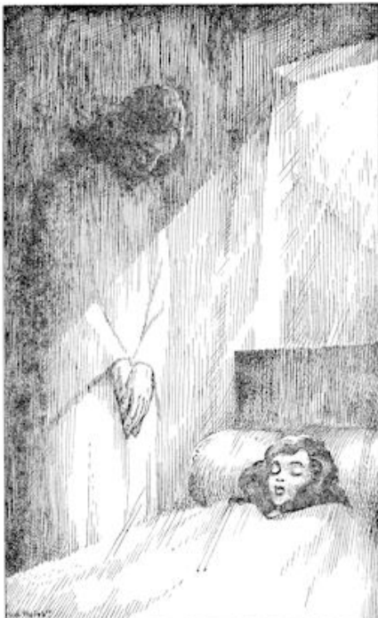
Zij kwamen in een klein vertrek, waar het meisje lag opgebouwd. (blz. 417)