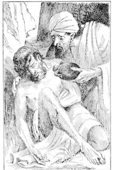
Hij goot wat zijn tassen de lippen van den lijder, begon zijn wonden te verzorgen en te wassen met olie. (blz. 424)