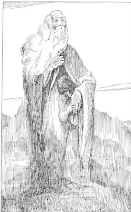
Het duurde even, voor Abraham daarop antwoord gaf. Toen zei hij: „God zal zelf voor een offer zorgen, mijn jongen.” (blz. 28)