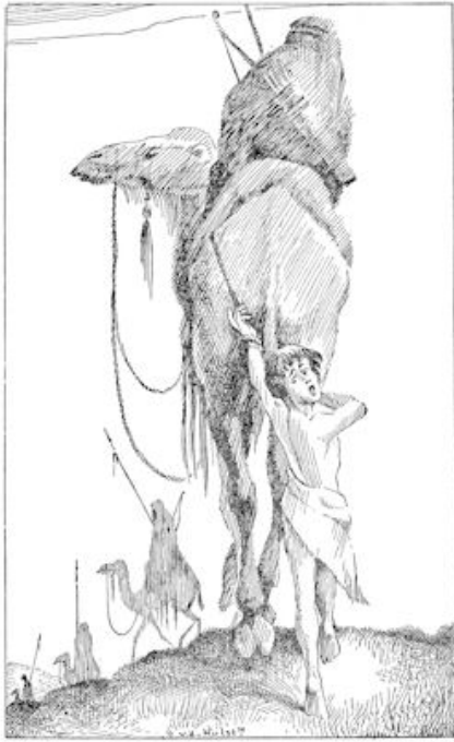
Jntassen legde Jacef, Raachel's zoon, als slaaf de lange weg af naar Egypte. De kooplieden reden op kamelen, maar de knechten en de slaven moesten lopen. (blz. 46)