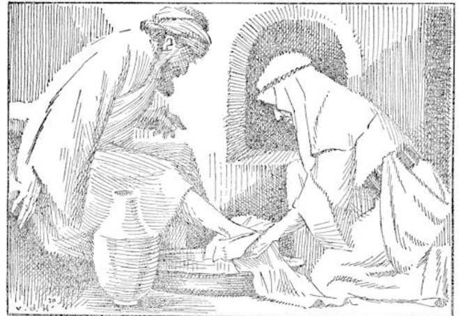
Hij legde Zijn feestkleed af, bond een linnen doek om, die dienen moest om de voeten der gasten af te drogen, schonk water in het bekken, dat gereed stond en begon het slavenwerk te verrichten, dat geen van de discipelen doen wilde.