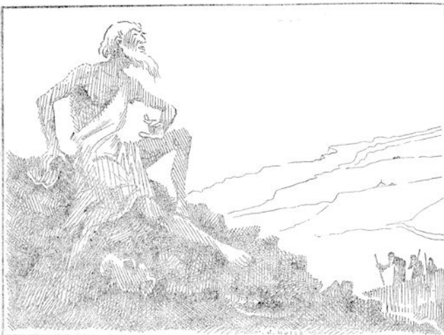
Zijn hele lichaam was met builen bedekt en hij leed ontzettende pijn. (blz. 322)