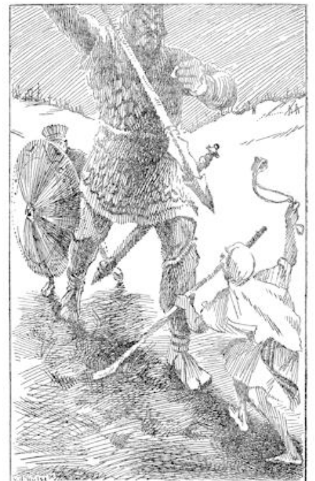
„Dank jij dat ik een hoofd ben!” bralde hij. „dat je met een stok op mij afkomt?”