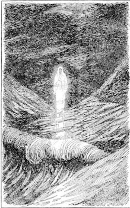
Ploteling gaf een van hen een kreet en wees met uitgestrekte vinger naar iets, dat over het donkere water naar hen toe scheen te komen. Een witte gestalte was het en die kwam van de oever, waar zij waren afgevaaren. (blz. 440)