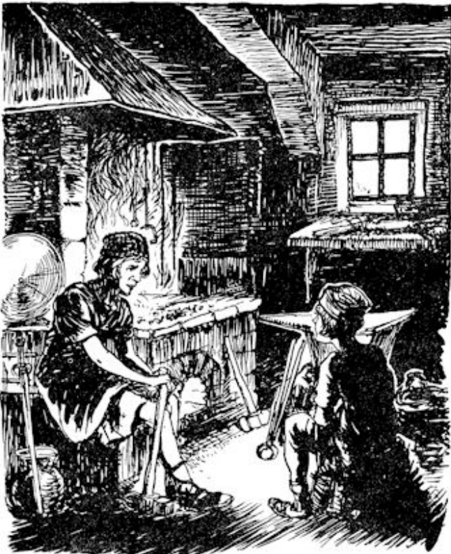
Hij zou, om het vak goed te leren, de wijde wereld intrekken.