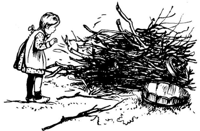
... had ze de kip plotseling ontdekt.