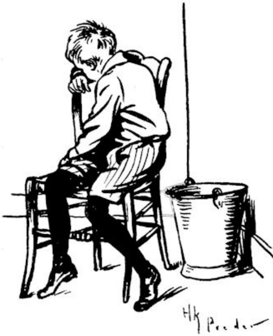
... in de keuken bonkte hij neer op een stoel.