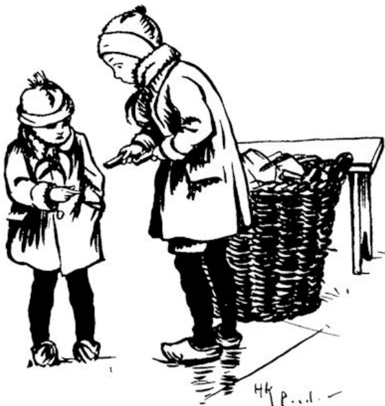
„Hier Kees” fluisterde hij.