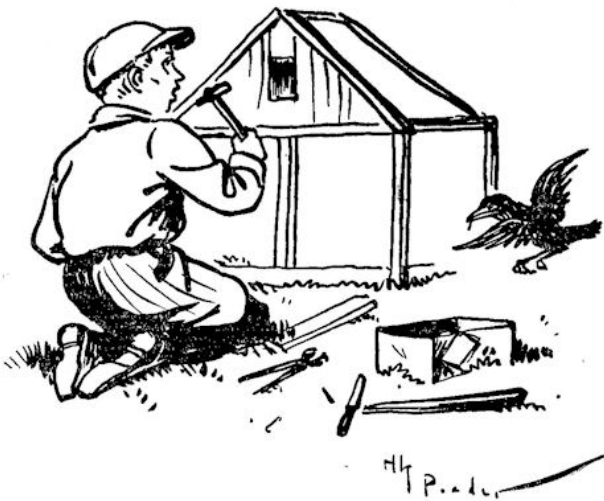
„Leelijk, gooi neer dat ding!”