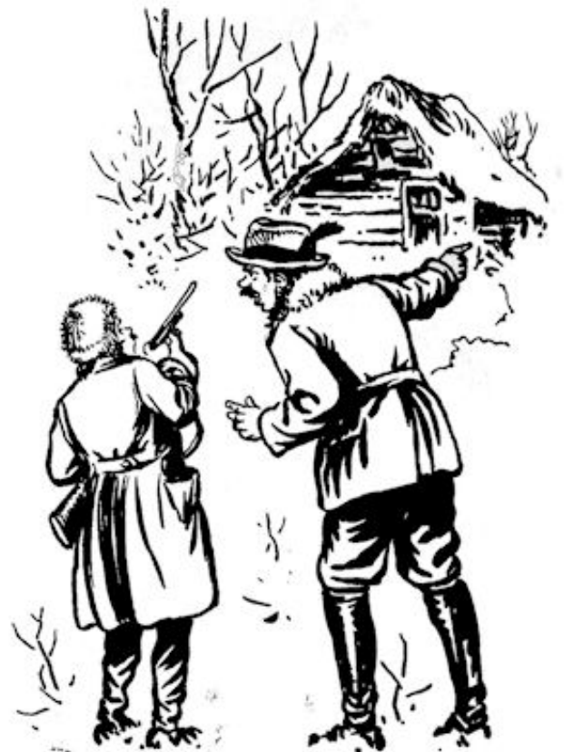
„Toe dan, schiet dan lummel!”