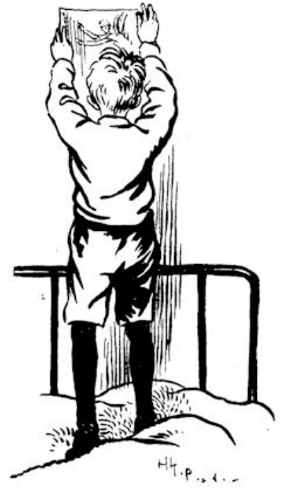
... hangt hij hem dadelijk boven z'n bed.