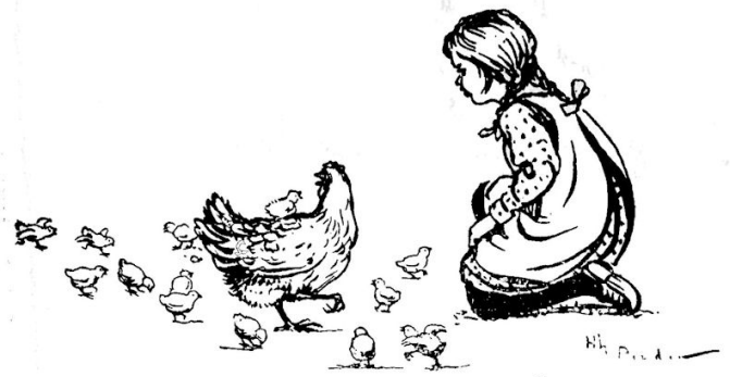
... en dertien gele vlokjes volgen haar.