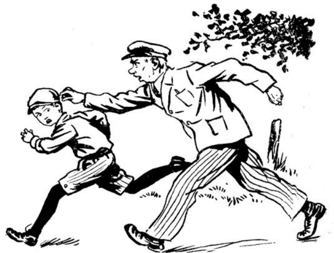
Daar waren ze, de knuisten.