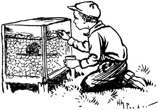
Op zijn knieën lag hij en teekende . . . . .