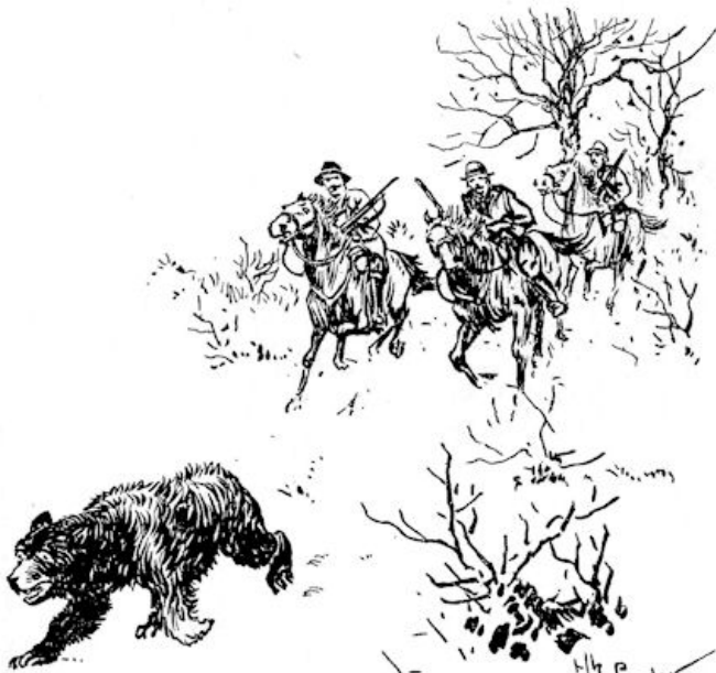
Maar de beer draaft ongestoord verder.