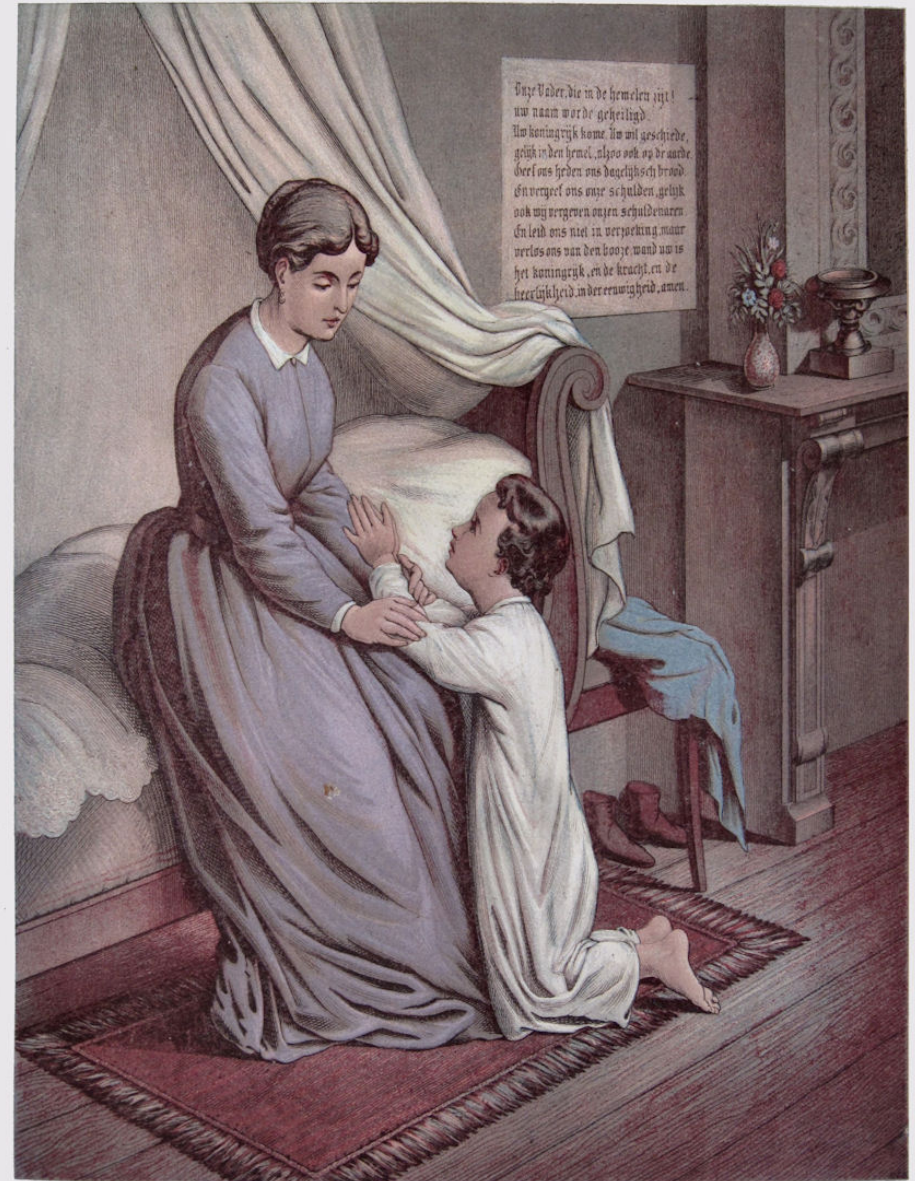
Tresting & Co. Hof Luth. Amst.

Heel ons hart zij U gewijd, Tot G' ons eens uit allen strijd Eeuwig in Uw Huis verblijdt, Onze Vader!