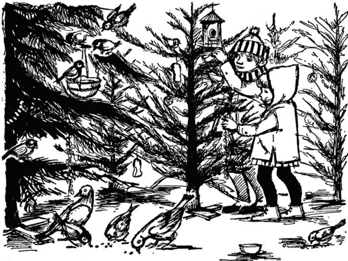
Tweede opgave. De verhalenplaat