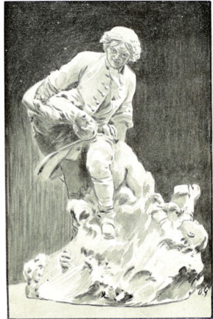
STANDBEELD VAN TSAAR PETER DEN GROOTE TE ST. PETERSBURG hem voorstellende als redder van schipbreukelingen te Kronstadt in 1721