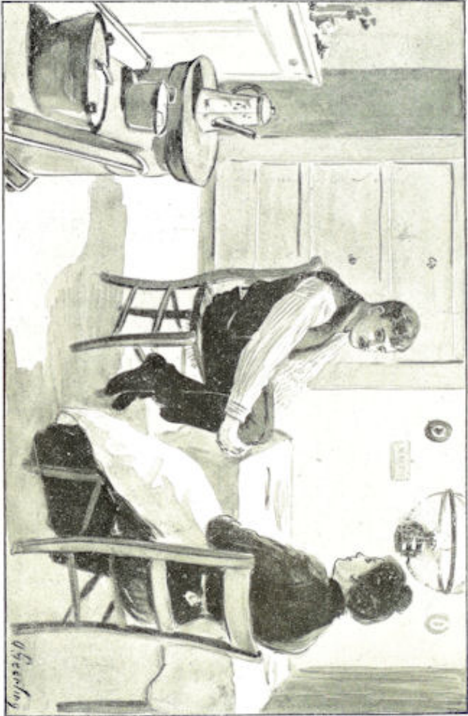
.... sloeg zijn lange armen om z'n hoog opgetrokken knieën, .... blz. 61