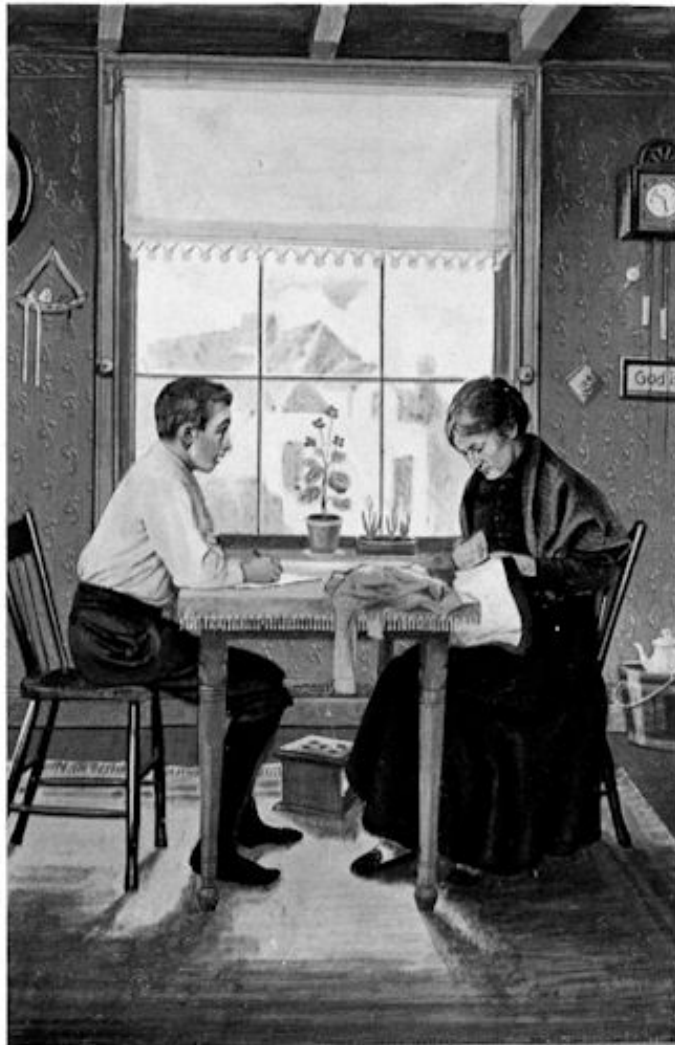
.... die opeens een uitroep van verbazing deed hooren.... blz. 18