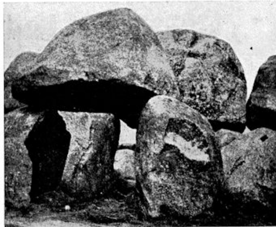
De poort van het Havelter-hunnenebed

We moeten gaan zoeken naar het groote werk