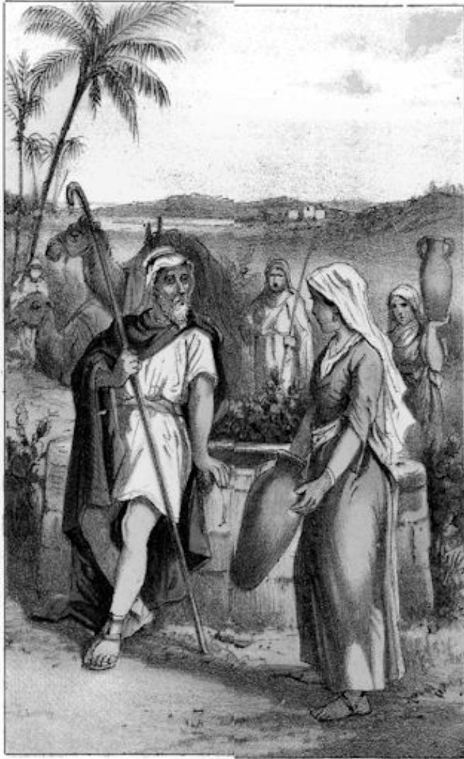
en haar vraagt om met hem mede te gaan