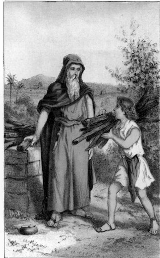
Welk een hartverscheurende arbeid was dit voor hem

Maar eensklaps: wat was dat? Daar hooren vader en