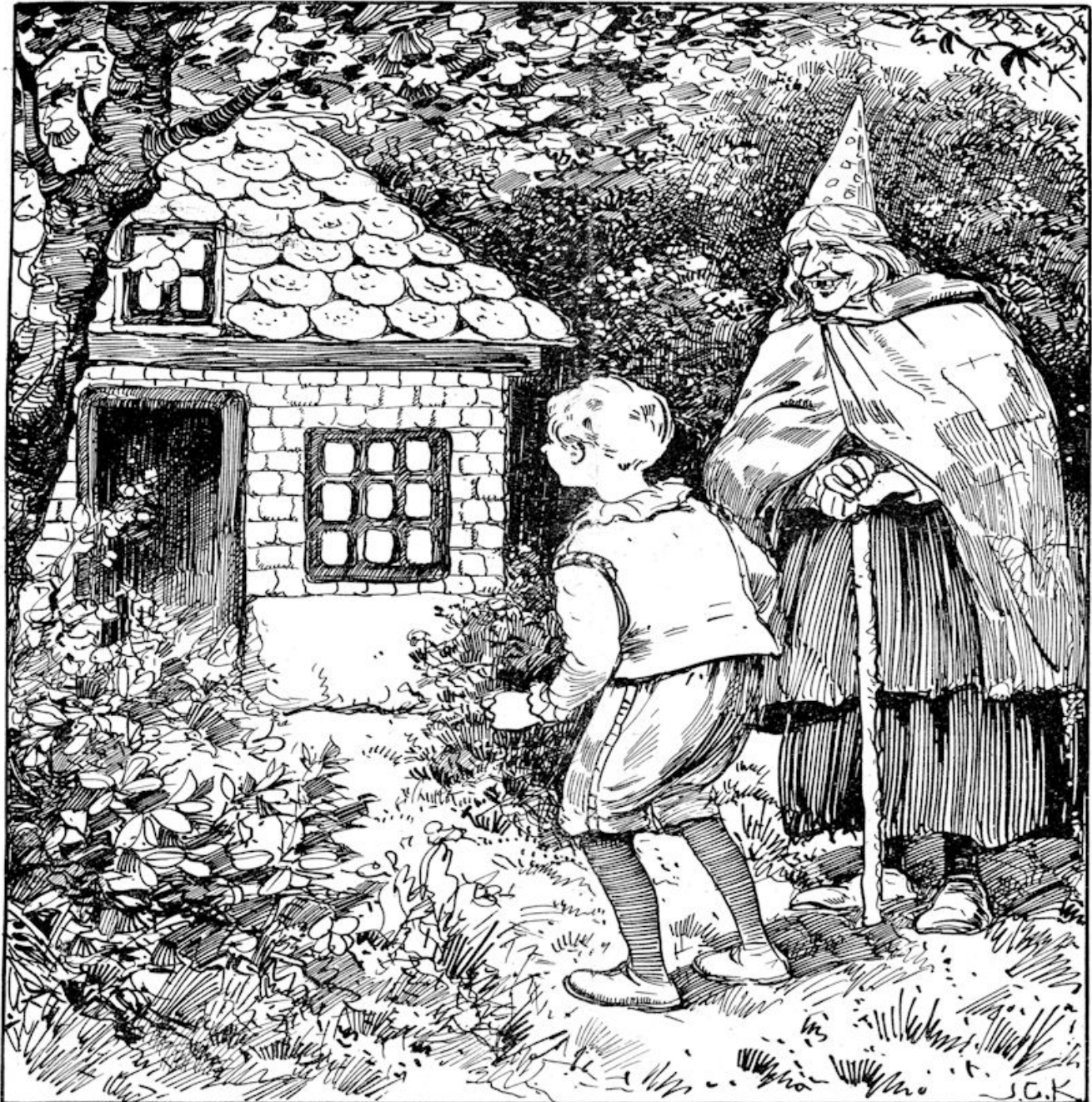
Illustratie bij „Het Pannekokenhuisje.”

CHRISTELIJK WEEKBLAD VOOR JONGENS EN MEISJES VAN ZES TOT VEERTIEN JAAR. VERSCHIJNT IEDEREN VRIJDAG — ABONNEMENTSPRIJS f 1.— PER KWARTAAL UITGAVE VAN DE UITGEVERSMATSCHAPPIJ E. J. BOSCH JBZN. TE BAARN.