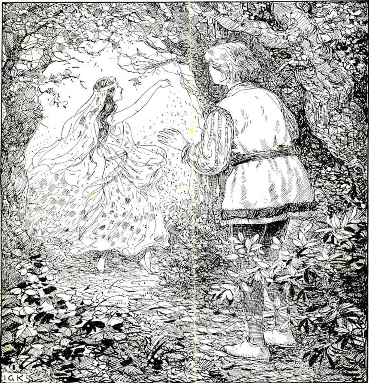
Illustratie bij „De Herfstfee.”

CHRISTELIJK WEEKBLAD VOOR JONGENS EN MEISJES VAN ZES TOT VEERTIEN JAAR. VERSCHIJNT IEDEREN VRIJDAG — ABONNEMENTSPRIJS f 1.— PER KWARTAAL UITGAVE VAN DE UITGEVERSMATSCHAPPIJ E. J. BOSCH JBZN. TE BAARN.