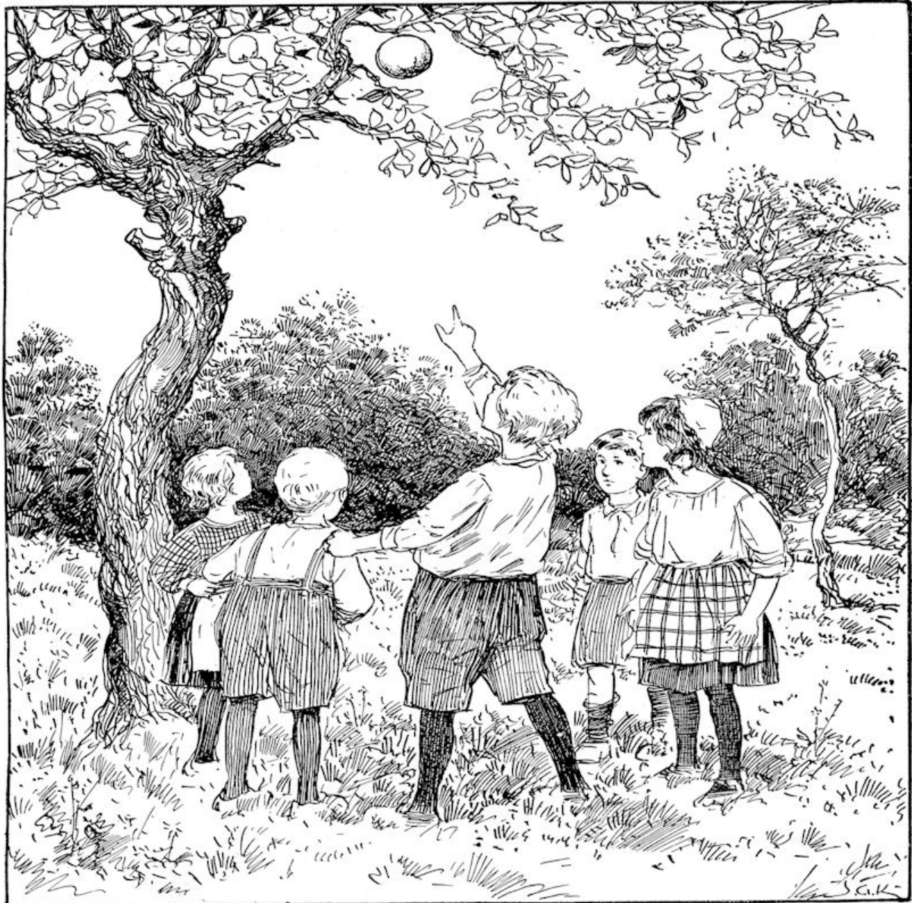
Illustratie bij „Soort bij soort.”

CHRISTELIJK WEEKBLAD VOOR JONGENS EN MEISJES VAN ZES TOT VEERTIEN JAAR. VERSCHIJNT IEDEREN VRIJDAG - ABONNEMENTSPRIJS f 1.- PER KWARTAAL UITGAVE VAN DE UITGEVERSMATSCHAPPIJ E. J. BOSCH JBZN. TE BAARN.