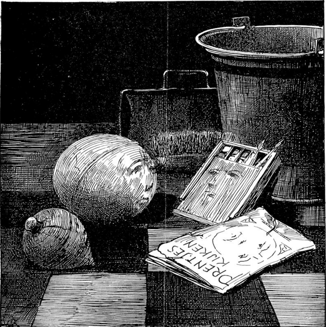
Illustratie bij „De vluchtelingen.”

CHRISTELIJK WEEKBLAD VOOR JONGENS EN MEISJES VAN ZES TOT VEERTIEN JAAR. VERSCHIJNT IEDEREN VRIJDAG — ABONNEMENTSPRIJS f1.— PER KWARTAAL UITGAVE VAN DE UITGEVERSMATSCHAPPIJ E. J. BOSCH JBZN. TE BAARN.