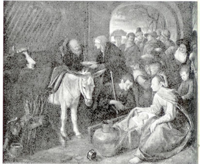
Aanbidding der herders (J. Steen, Rijksmuseum, A'dam).

Met verbaasde en tegelijk bevreesde ogen keken ze naar die Engel. Wat zou er nu gebeuren? Zouden ze nu moeten sterven? Een hevige angst greep hen aan en toen hoorden zij opeens de Engel heel duidelijk zeggen: „Vreest niet!” Hij had dus gezien, dat zij bang waren. „Weest niet bevreesd,” zei hij, „want zie, ik verkondig u grote blijdschap, die heel het volk ten deel zal vallen: U is heden de Heiland geboren, namelijk Christus de Here in de stad van David. En dit zij u het teken: Gij zult een kind vinden in doeken gewikkeld... en liggende in een kribbe.”