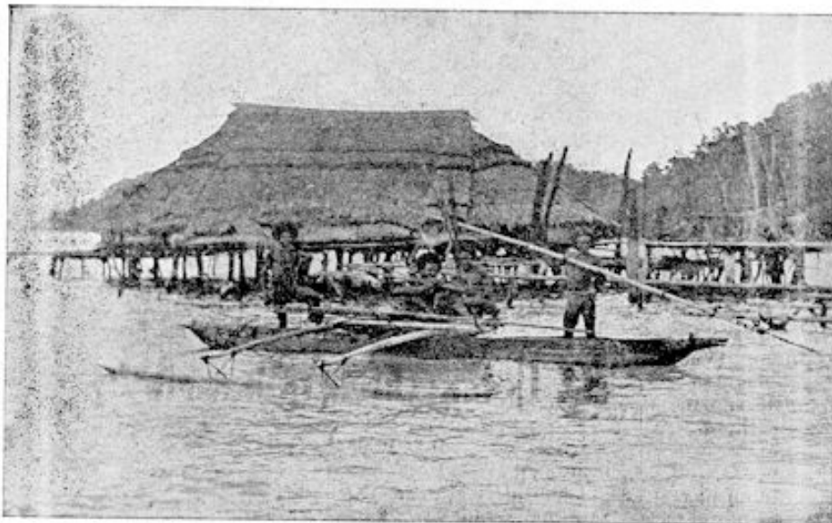
Vissende Papoea's. Met hun speren vangen zij de vissen

Nee, de moeilijkheden van die eerste zendelingen in Papoea-land zijn niet te