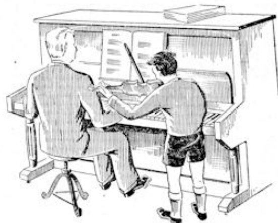
Mijnheer aan de piano en hij... op z'n viool

Na die eerste morgen was het zo gebleven; altijd zei hij weer: „Goeie morgen, baas!”