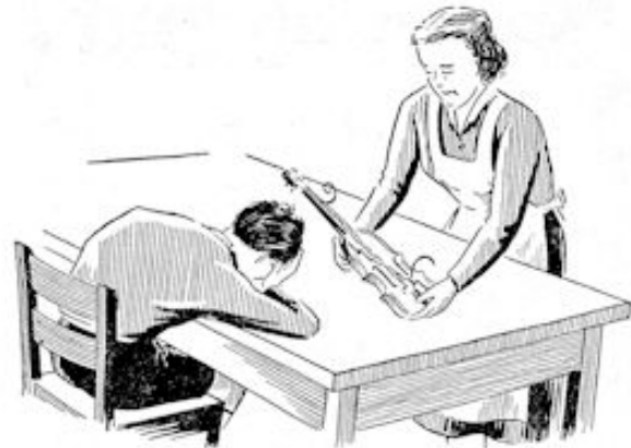
Toen nam ze aarzelend en voorzichtig de viool

Gebroken... gebroken... En dat door hém... Hij had het geluk van zijn gebrekkige jongen stukgegooid. Hoe had hij dit kunnen doen? Een traan viel naar beneden, over zijn vest. Niemand zag het... O, o, hij zou het zijn jongen zeggen, hoe vreselijk dit hem speet. Hij zou hem vergeving vragen. En beloven, dat hij nooit,