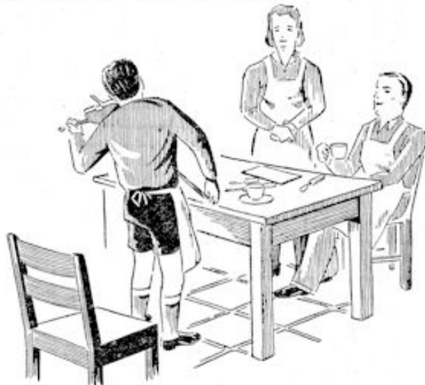
En Eppo speelt nog eens voor ons, hé?

„Dan drinken we met ons drietjes een kopje. En Eppo speelt nog eens voor ons, hé?”