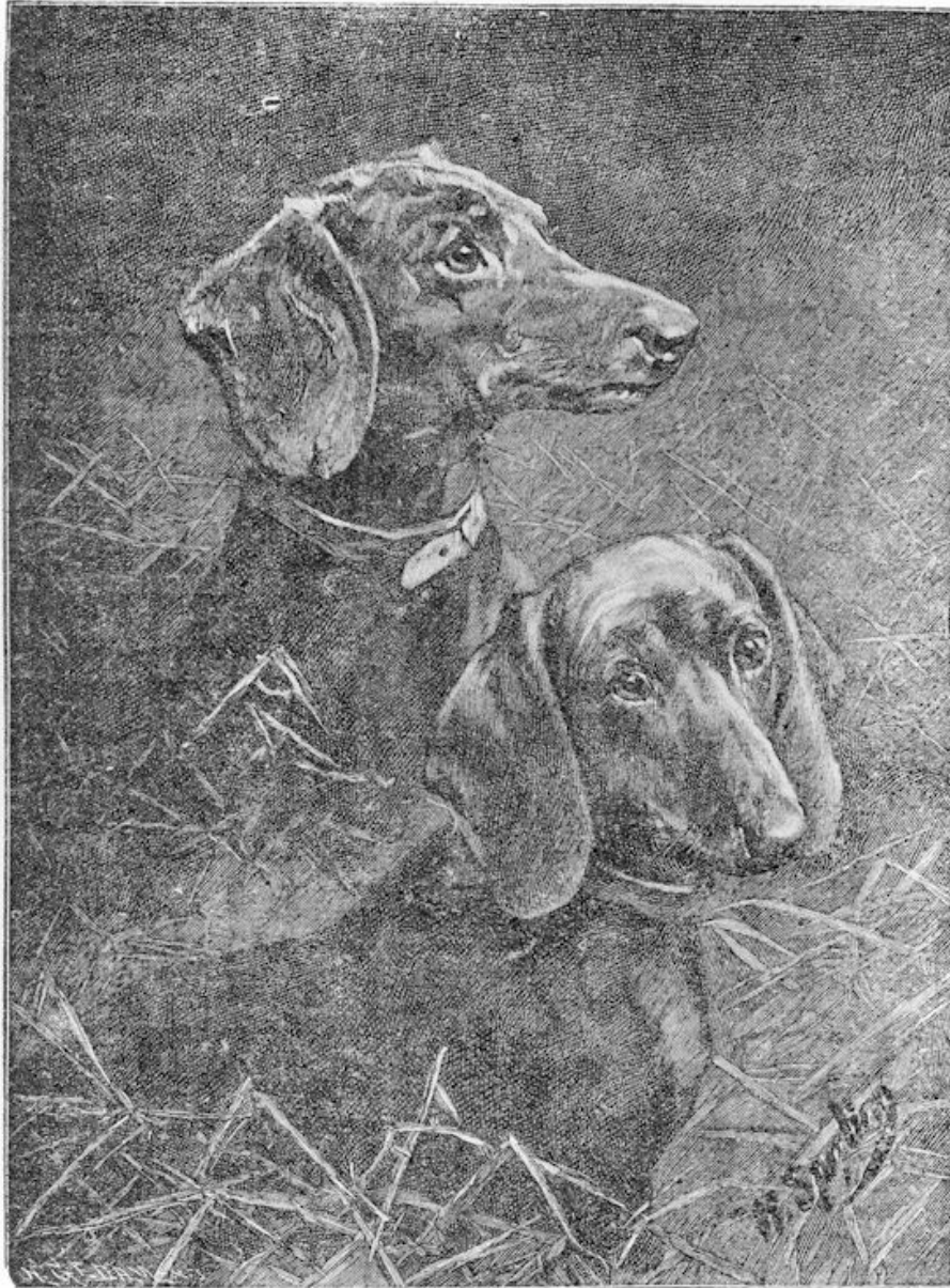
Taxen of Tekkels.

scherpen reuk, zoodat hij het vleesch spoedig gewaar wordt en er op afgaat, den draad meevoerende.