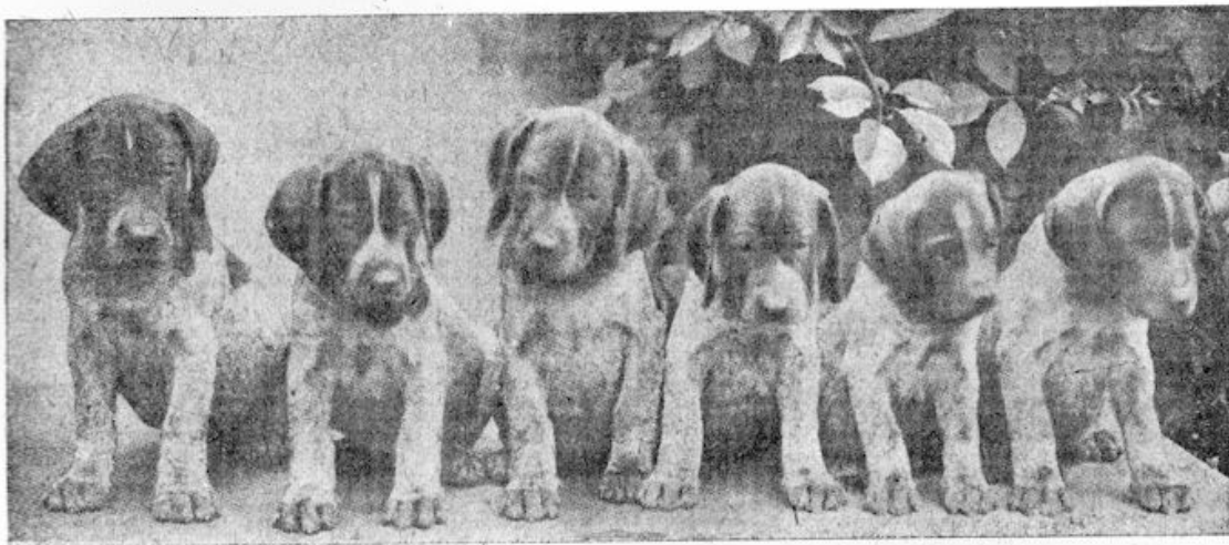
Uit één, nest, (kortharige Duitsche honden).

Als politiehond afgericht bewijzen Schotsche en Duitsche herdershonden alsook de zoogenaamde Airedale terriers uitstekende diensten bij het opsporen van misdadigers. En hun