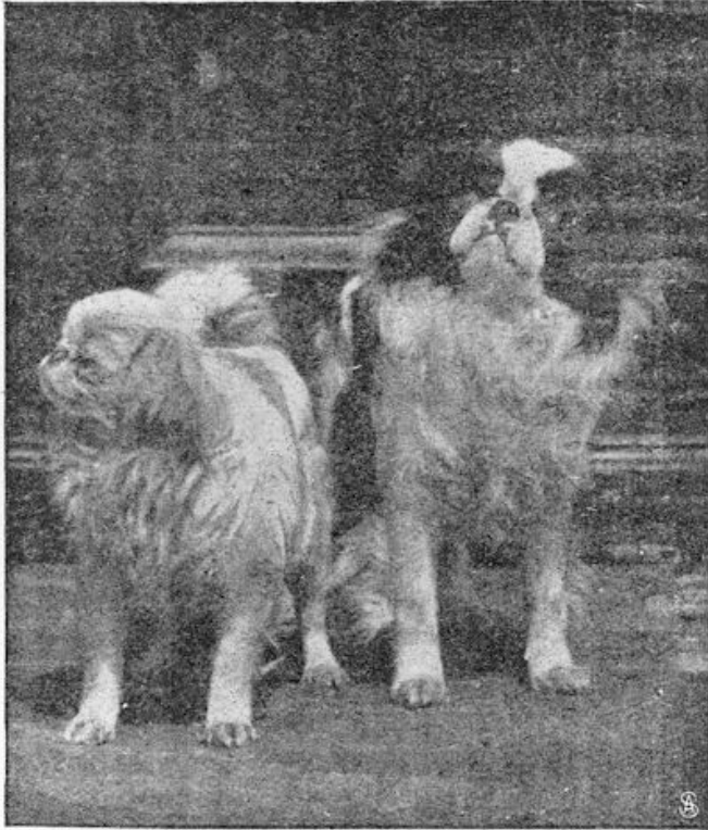
Schoothondjes (Japansche Chin's).

oude Egyptenaren. Ook in dat opzicht is er niets nieuws onder de zon. Het fokken van die miniatuur hondjes is een