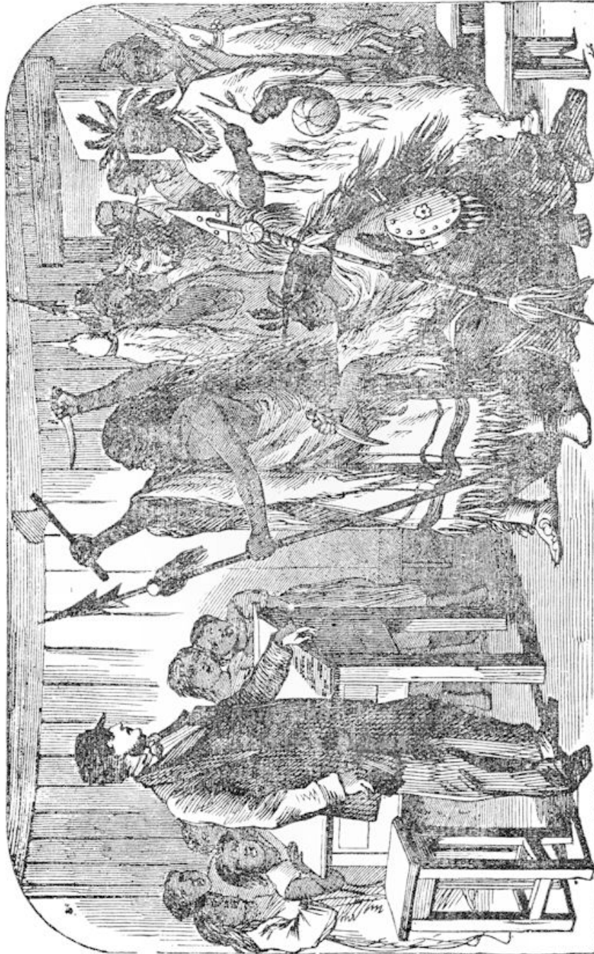
Huilend en tierend dringt de bende het vredige schoollokaal binnen.