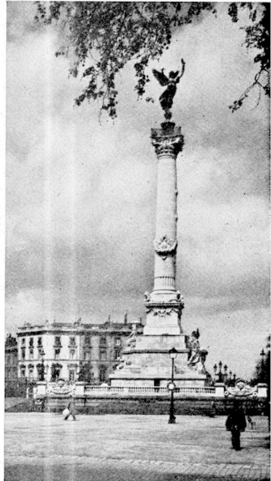
Bordeaux — Monument ter ere van de Girondijnen.

Een ander groot standbeeld verheerlijkt de revolutie van 1848. Er zijn monumenten van de oorlog van 1870, van die van 1914—1918 en er wordt er thans een gebouwd ter herinnering aan de oorlog van 1939—