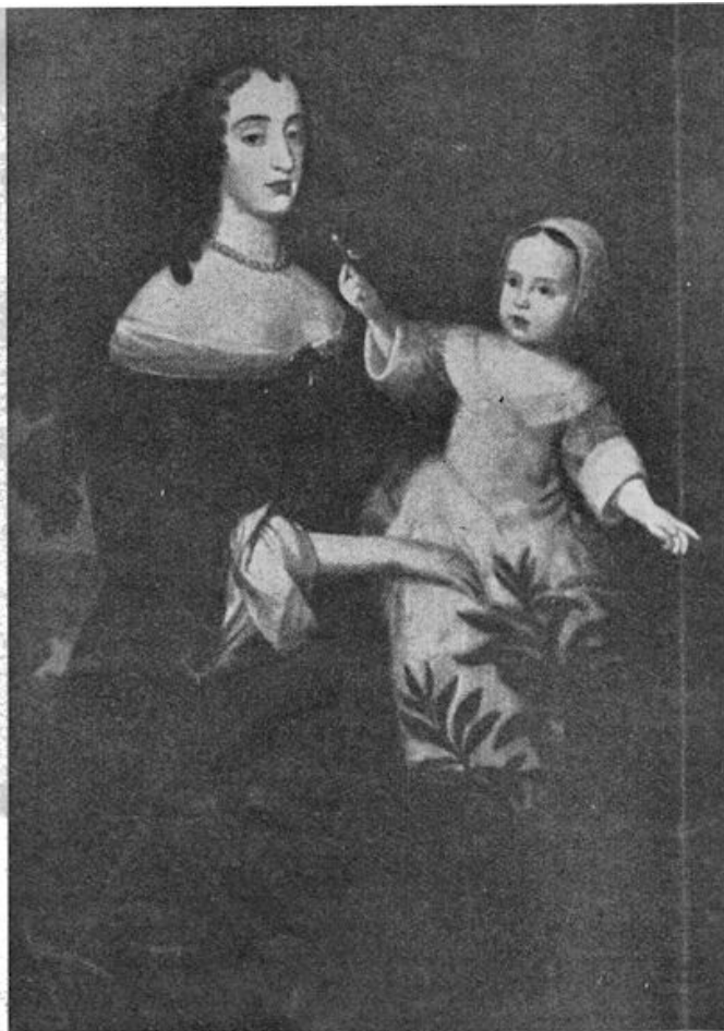
Schilderij van W. Honthorst. — Prins Willem III als baby met zijn moeder Maria Stuart I. (Eigendom van het Gemeentebestuur van Breda)

na zijn overlijden, 14 November 1650, werd in het Paleis op het Noordeinde een Prinsje geboren. Urenlang stonden honderden mensen in spanning te wachten op berichten. 't Was een gure Novemberavond en er viel een kille motregen. Maar dat deerde de wachtenden niet. Ze konden onmogelijk rustig thuis zitten vóór ze het wisten.