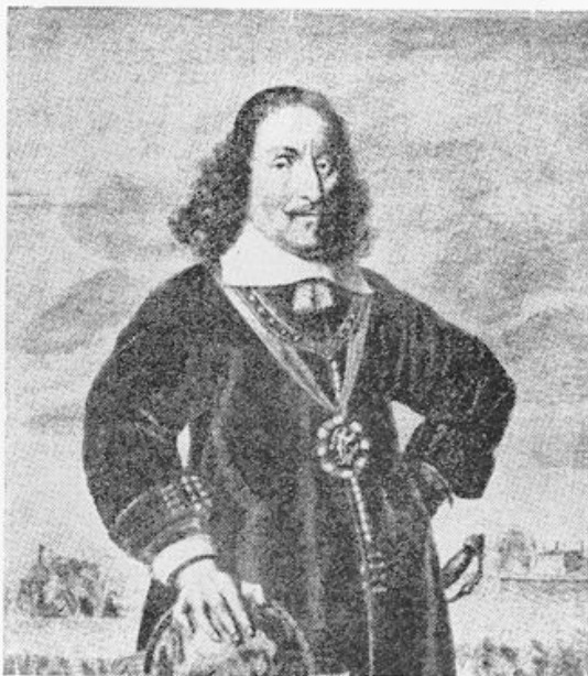
Admiraal Witte Cornelisz. de With

volkje heeft later heel wat last veroorzaakt. Johan Maurits werd bij zijn moeilijke taak niet voldoende gesteund door de heren bewindhebbers. Om de stad San Salvador te heroveren, had de gouverneur troepen nodig en die werden hem vanuit het moederland niet gezonden. Hij was veel te voortvarend naar de zin der Heren; zijn werk daar kostte geld en de Heren waren er op uit, geld te verdienen. Daarom riepen ze hem in 1644 terug. Daarmee was feitelijk onze kolonie toen al verloren.