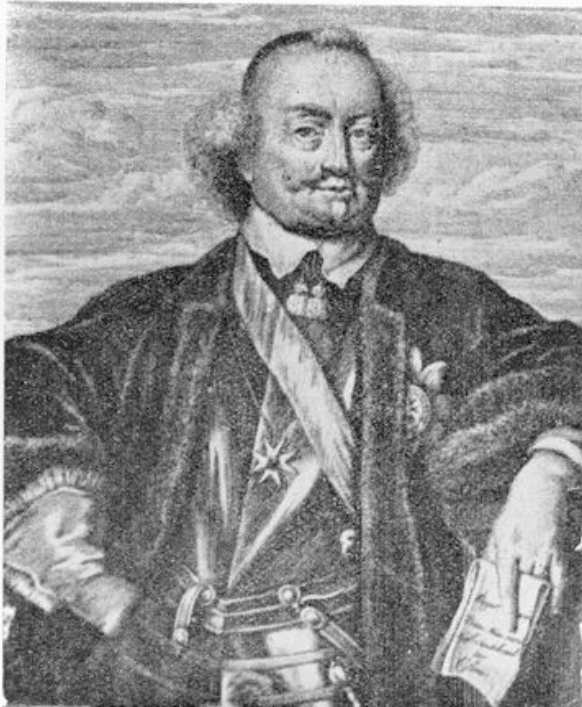
Johan Maurits Van Nassau

Dese Nassauer, een kleinzoon van Jan van Nassau, de broer van Prins Willem I, was 17 Juni 1604 geboren. Reeds op 17jarige leeftijd kwam hij in 't Nederlandsche leger en toen hij 25 jaar was, werd hij