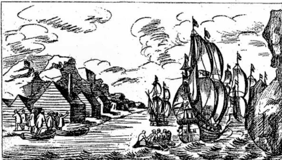
De Hollandse schepen verlaten Smeerenburg op Spitsbergen.

Toen in de zomer van 1635 de vloot weer terug kwam, was er niet één meer in leven. In het houten huis, waarin ze hadden gewoond, vond men een soort dagboek, waarin een hunner had opgetekend, wat hun zoal was overkomen. De namen van het zevental zijn ons bewaard gebleven. Het waren: