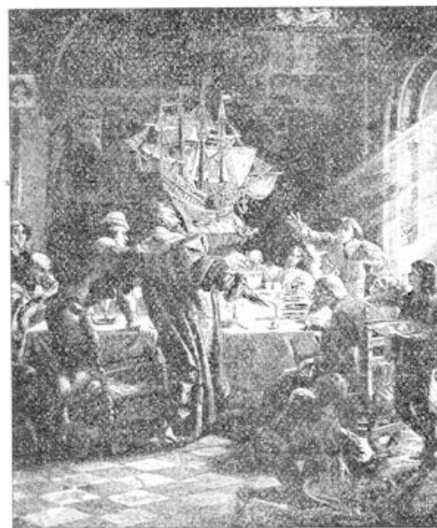
Columbus zet een ei op z'n punt.

Maar hij deed het niet met z'n hart. Elk ogenblikje, dat hij vrij had, stapte hij naar de haven en dan tuurde hij naar de schepen, die af en aan voeren, de wijde zee over naar de verre horizon. Zeeman zijn, dat leek hem vrij wat beter, dan wever wezen. Hij praatte er met vader over, maar die had er geen oren naar. Doch Chris hield vol en eindelijk begreep zijn vader toch, dat er in de jongen geen flinke wever zat, en al verwachtte hij er niet veel goeds van: Chris moest dan maar naar zee. Zo werd Columbus matroos op een Portugees schip. In die tijd waren de Portugezen de grootste zee-