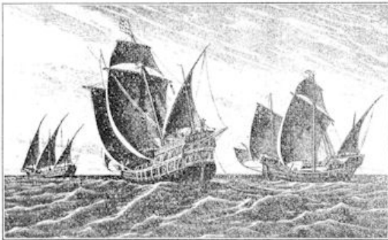
De „Santa Maria”, het schip van Columbus.

vaarders van Europa. Wat deed de jongen z'n best.