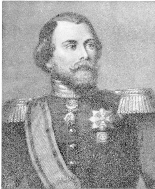
Koning Willem III

Meer dan veertig jaren heeft de koning in trouw en toewijding over ons volk geregeerd. Een dichter noemde hem eens „een spruit van vijftig helden”. Ik heb het niet nageteld, maar dat zal wel zo zijn. Intussen heeft de laatste koning op het slagveld nooit zijn vaderland behoeven te dienen. „Ik heb nooit anders dan los kruit geroken,” moet de Koning eens gezegd hebben en men kon horen, dat hem dit geweldig speet. Doch op een ander gebied heeft hij wel getoond een held te zijn. Toen in 1861 de Bommelerwaard en andere delen van ons vaderland